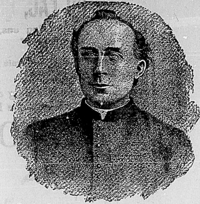
Un Portrait au Crayon agrandi, de 18 par 24 pouces, copié d'une des meilleures photographies du Rév. Père Morrissy, ce prêtre-médecin de si haute renommée, a été fait pour les admirateurs de ce prêtre, ou de ses prescriptions merveilleuses. Il est beaucoup mieux que la reproduction ci-dessus, c'est un magnifique portrait, qui vaut la peine d'être encadré. La Father Morrissy Medicine Co., Ltd., de Chatham, N.B. sera heureuse d'envoyer ce portrait, absolument gratuit, à tous ceux qui écriront pour l'avoir.

—Fers électriques, lumières électriques de 2, 4, 5, 8, 10, 16 lumières, en vente à la Librairie Bourbeau. Nous donnerons réduction sur les fers électriques d'ici quelques jours.