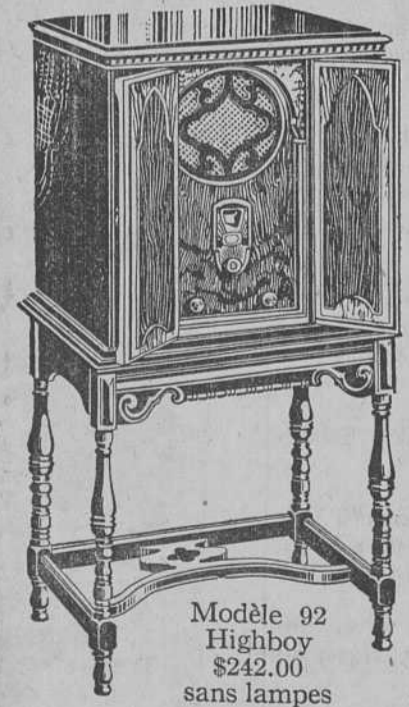
Modèle 92 Highboy $242.00 sans lampes

Décidez maintenant de faire chez vous un "Noël Majestic". Le Club de Noël Majestic vous réservera le modèle que vous désirez. Venez aujourd'hui et apportez cette annonce. Elle vous donne droit à votre entrée immédiate dans le Club.