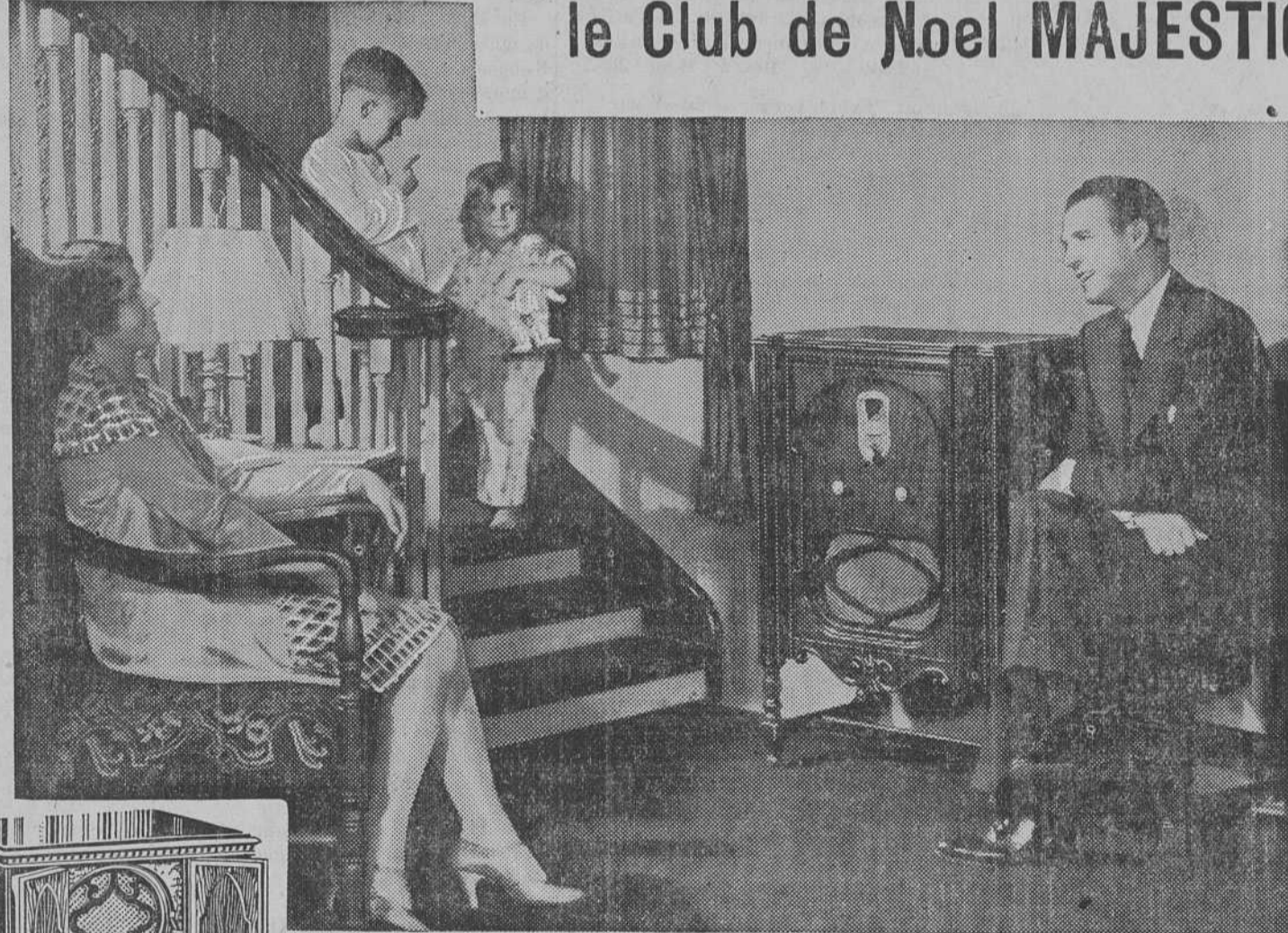
Modèle Majestic 91 Lowboy, $197. sans les lampes

EST-IL quelque chose qui puisse donner plus de plaisir à toute la famille qu'un Radio Electrique Majestic au matin de Noël?