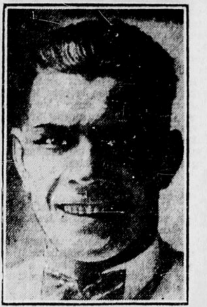
GENE TUNNEY a obtenu gain de cause dans la poursuite que lui intentait le politicien Tim Mara.

C'est hier après-midi que les élèves de l'Université ont entrepris leur dernier engagement de la saison régulière de 1930. Le rideau est baissé sur le rugby et ce fut par une victoire de 17 à 2 sur le Commerce que les savants juniors ont terminé leurs opérations.