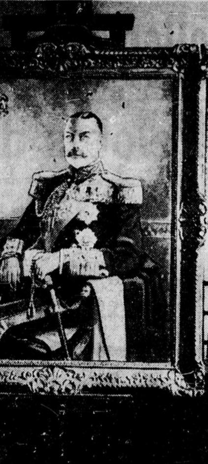
Un nouveau portrait de Sa Majesté le Roi, peint par M. Gerald Hudson pour le British Commonwealth Club, de New-York. Le défilé en a été fait le jour anniversaire de l'armistice par l'ambassadeur d'Angleterre. La vignette représente M. Hudson avec le portrait.