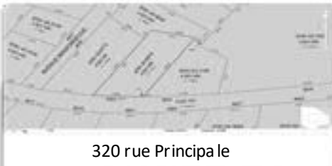
320 rue Principale

La Municipalité met en vente un terrain d'une superficie de 1 214,4 m 2 , (+/- 13 071 pi 2 ) façade de 26,48m (+/- 86 pi), profondeur irrégulière d'environ 50,09m (+/- 164 pieds), déjà desservi en aqueduc et égout. Localisation: 320, rue Principale. Prix: 7 000$, conditionnel à ce qu'une résidence soit construite dans un délai maximal de 2 ans.