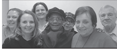
Équipe du journal