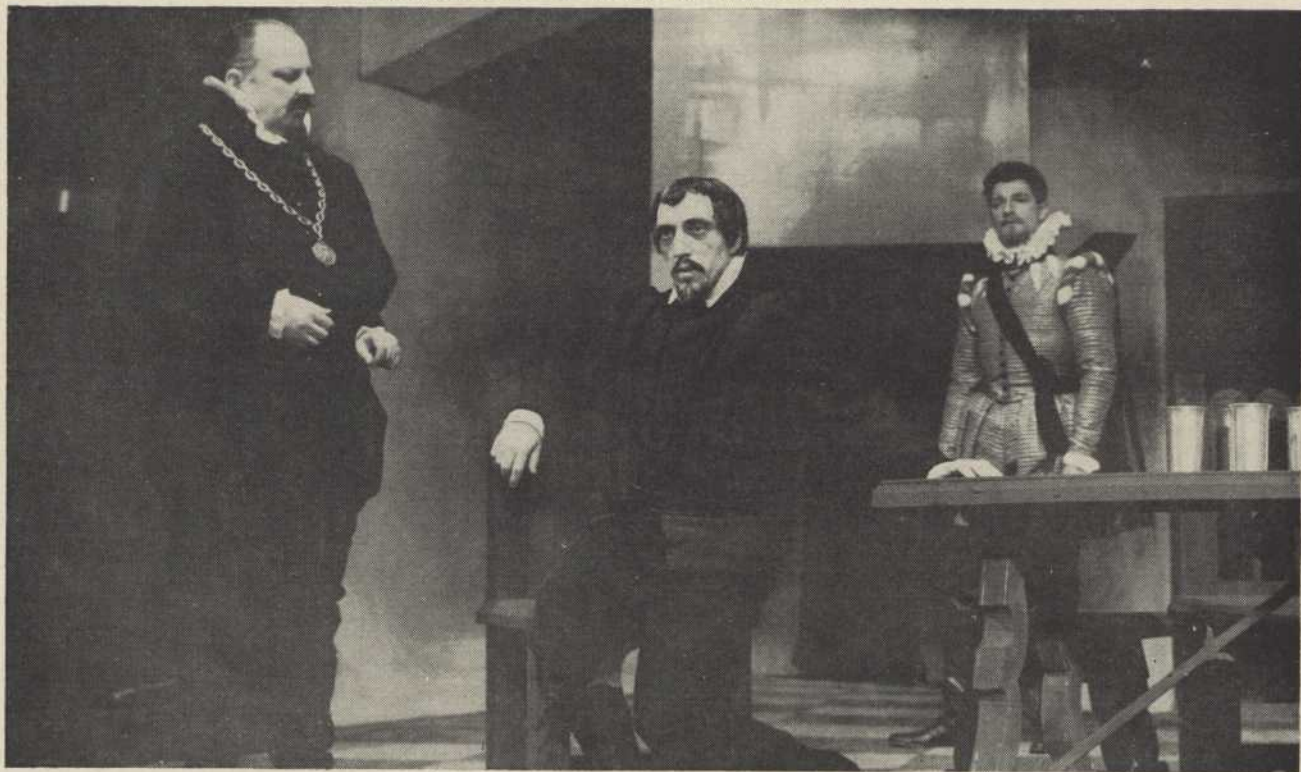
Le MAÎTRE DE SANTIAGO, de Henry de Montherlant.