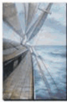
Tableau 39 x 59 po. 439,99 $