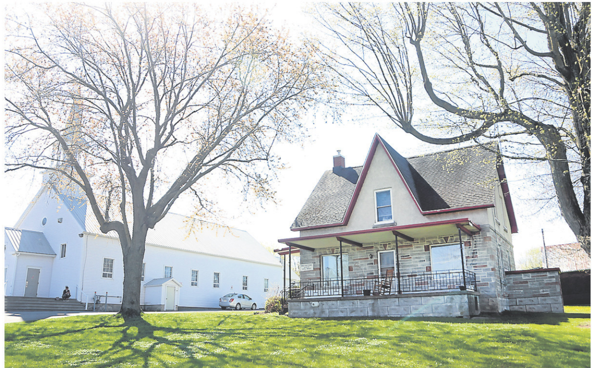
Le presbytère de Saint-Alphonse-de-Granby passera dans le giron de la Municipalité.

Ensuite, des modifications seront apportées à l'intérieur afin d'aménager une grande cuisine.