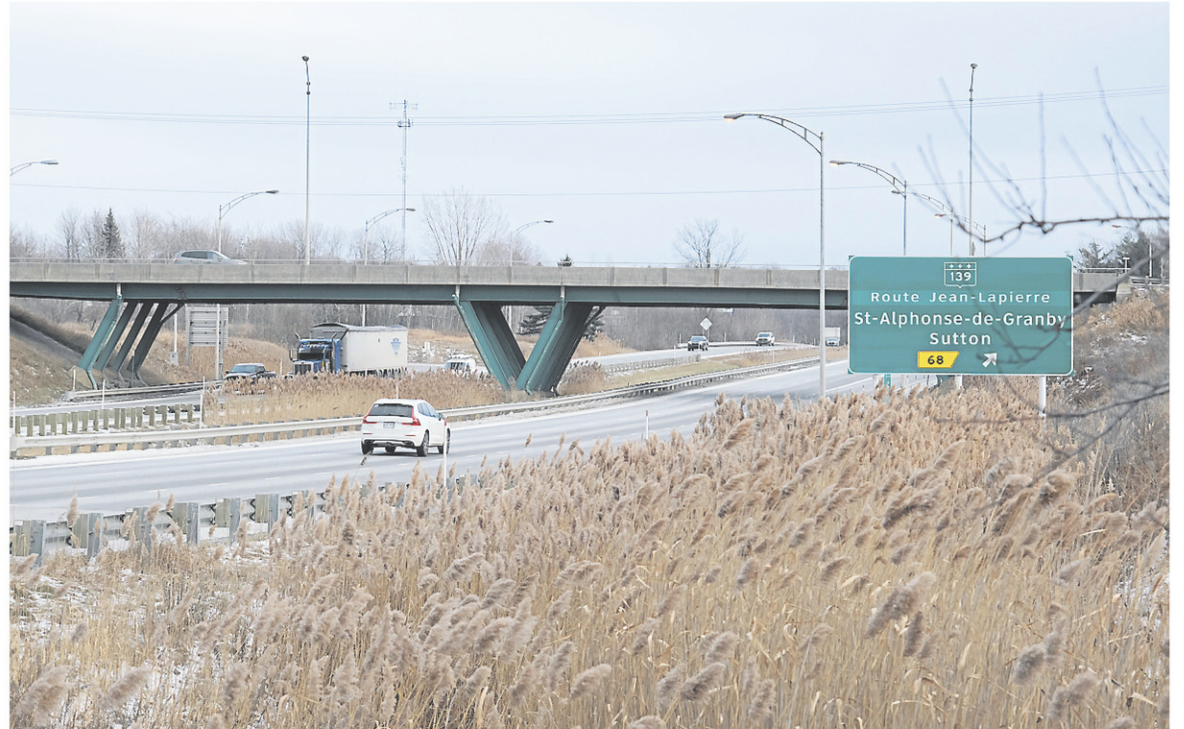
L'élargissement de la route 139 se poursuivra durant la saison estivale avec l'ajout d'un second viaduc, parallèle au pont Choinière, permettant de traverser l'autoroute 10 et de doubler les voies de circulation.

Par ailleurs, la cure de rajeunissement des sorties 68 et 78 de l'autoroute 10 en direction est devrait être complétée durant la saison estivale. « On est super content, c'est l'entrée de la municipalité, donc ça va nous faire une belle image. La sortie 68, c'est Saint-Alphonse », dit la directrice générale.