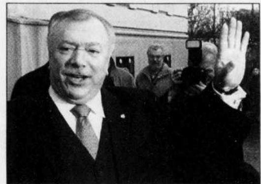
Le social-démocrate Michael Haeupl