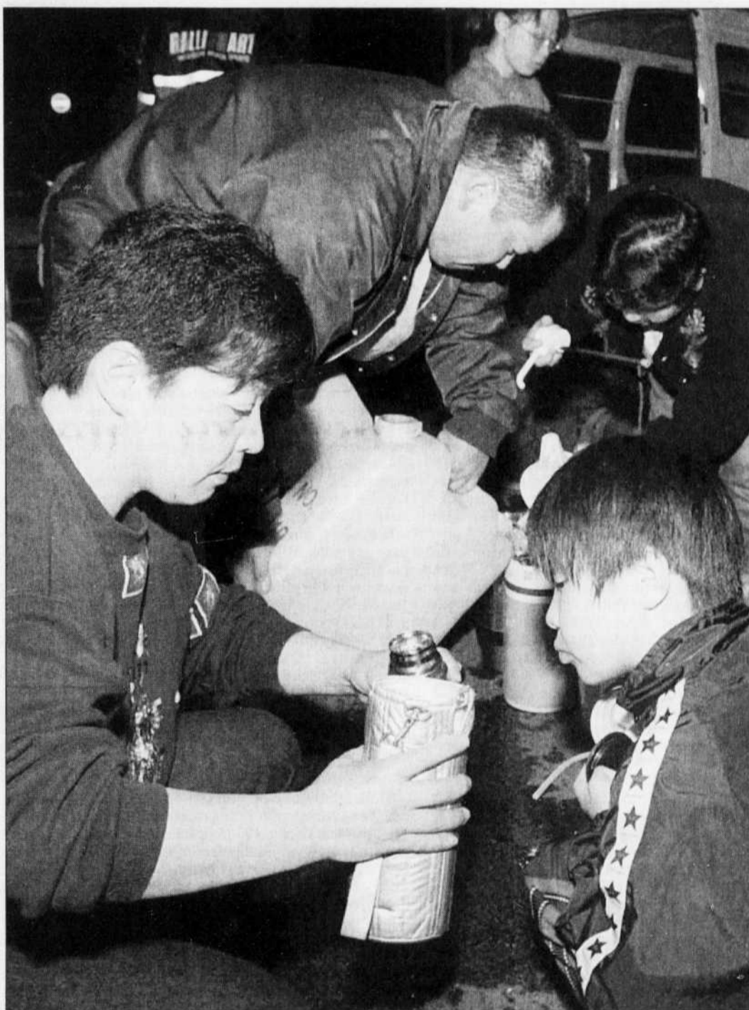
De la nourriture et de l'eau ont été distribuées hier dans la région d'Hiroshima aux victimes du plus grave séisme enregistré depuis Kobe en 1995.