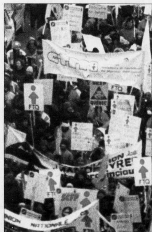
Dans le contexte de la mondialisation, les syndicats devront fournir plus d'efforts qu'auparavant pour maintenir leur pouvoir.