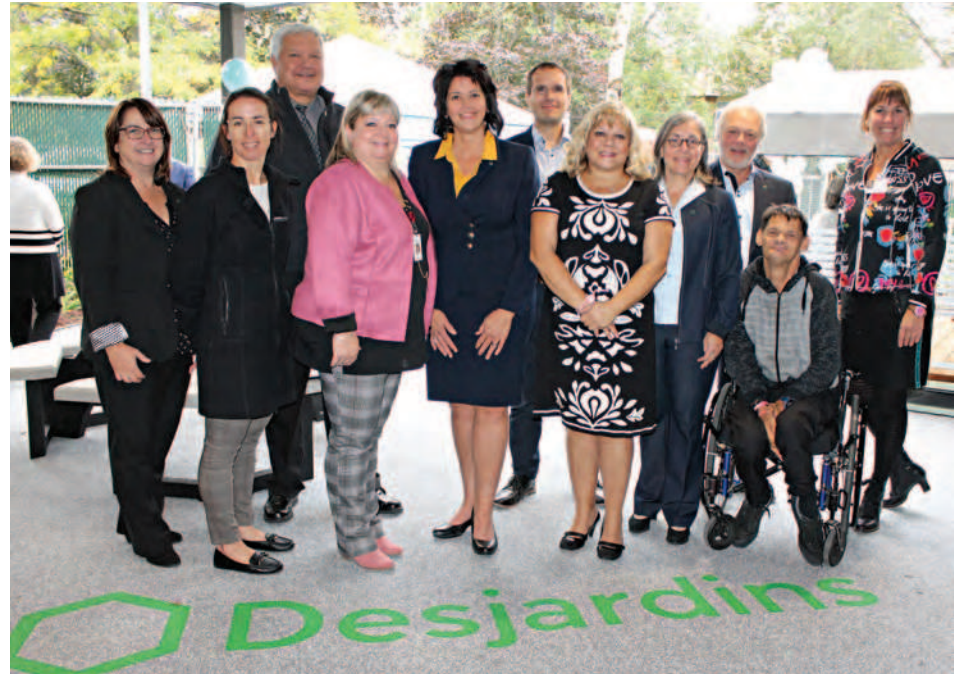
À la suite d'une aide financière de la Caisse Desjardins du Mont-Saint-Bruno, la terrasse du Centre d'hébergement Montarville a été inaugurée.