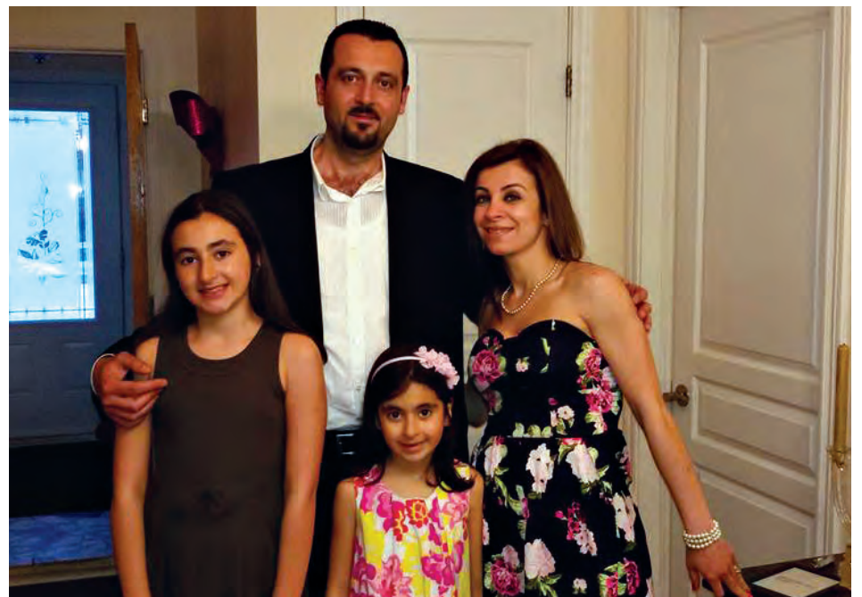
Le couple et les deux fillettes, arrivés en 2016.