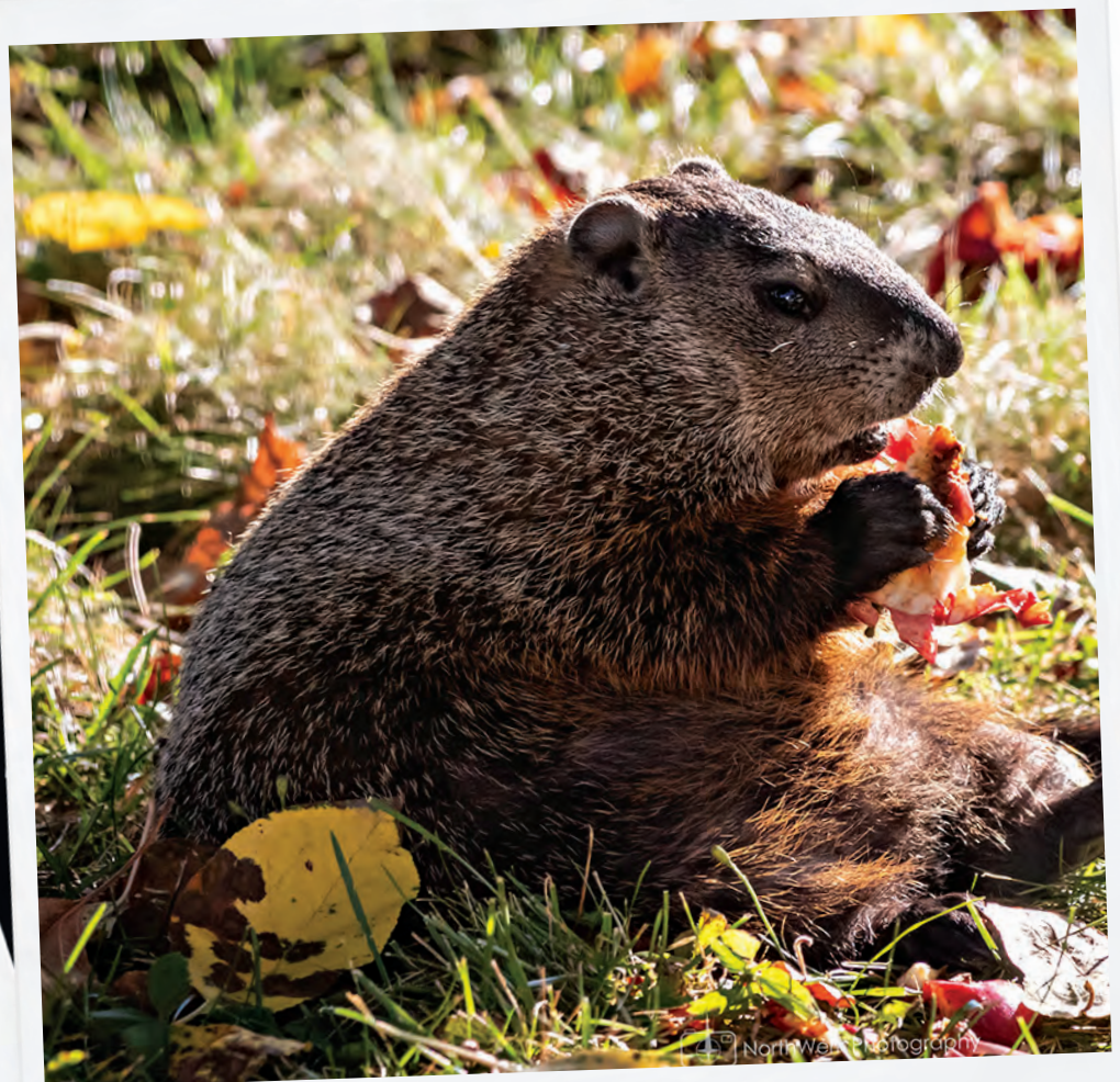
J'ai pris la photo dans notre cour, en arrière. Notre marmotte, « Bernard », adore manger les pommes qui tombent du pommier.

FAITES-NOUS PARVENIR VOS PHOTOS À REDACTION@VERSANTS.COM (Les photos publiées peuvent être réutilisées pour illustrer des articles de nos publications.)