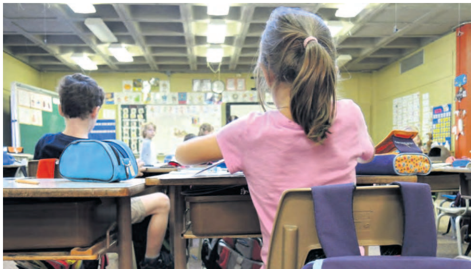
53 millions de dollars seront octroyés à la CSP pour la rénovation de ses écoles.

Pour M. Roberge, « toutes les études le prouvent : les milieux de vie dans lesquels évoluent nos élèves ont une incidence directe sur leur motivation scolaire, sur la qualité de leurs apprentissages et sur leur réussite. Tout gouvernement qui fait de l'éducation une vraie priorité devrait avoir à cœur le maintien des écoles en bon état. C'est notre cas. Nous lan-