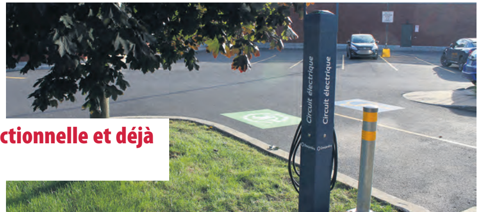
La borne installée sur le terrain de la Caisse Desjardins du Mont-Saint-Bruno est en place, fonctionnelle et déjà utilisée.

Cette initiative permet à Desjardins de contribuer à la transition énergétique et au développement socio-économique des communautés, et à Hydro-Québec de renforcer son réseau Circuit électrique. « Il s'agit d'un pas de plus