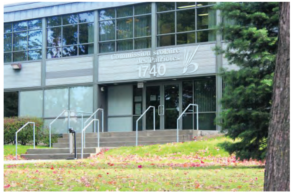
La CSP, dont le siège est à Saint-Bruno-de-Montarville, ne devrait plus exister sous sa forme actuelle dès février 2020.

« Ce sont des épouvantails qui sont agités par des gens qui comparent cela à la réforme Barrette en santé, alors que c'est tout le contraire. Nous, on maintient les centres, mais nous les transformons et le gouvernement ne