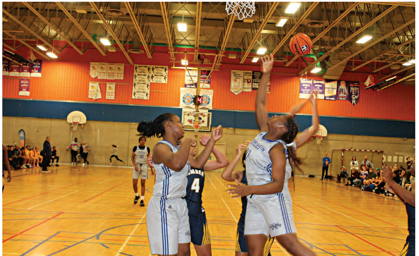
Un match enlevé, mais surtout un quatrième quart excitant jusqu'à la fin.