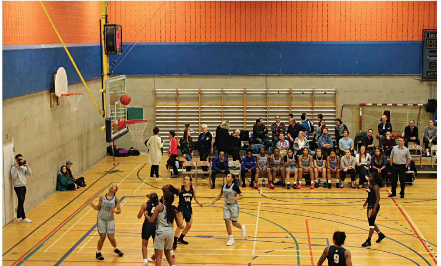
Les Lady Cavaliers du Collège Champlain de Saint-Lambert et les Hawks du Collège Humber de Toronto s'affrontaient à l'École secondaire du Mont-Bruno.

Avec ce 10 e rendez-vous, l'Association de basketball de Saint-Bruno souhaitait souligner le passé glorieux du programme féminin des Cougars. Rappelons que plusieurs joueuses ont évolué pour les Lady Cavaliers avant de poursuivre leur carrière à l'université.