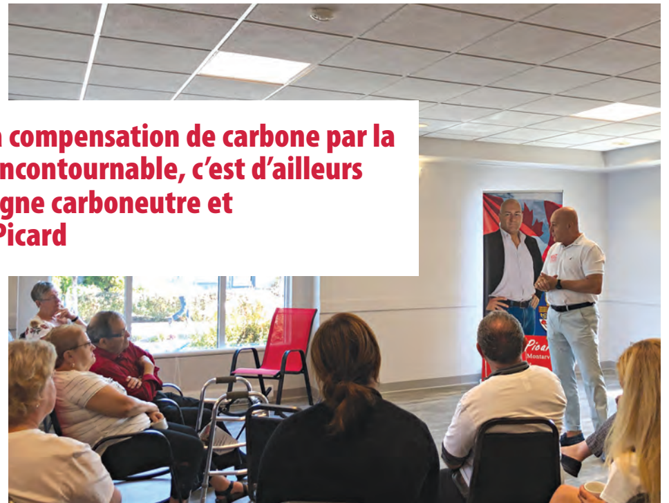
Michel Picard au lancement de sa campagne carboneutre et écoresponsable.

M. Picard dresse un bilan flatteur pour son gouvernement. « Il a protégé plus de 14 % des océans et cours d'eau depuis son entrée en mandat, s'engage à continuer le travail et à protéger 25 % des terres et 25 % des océans d'ici 2025. La protection de nos terres et de nos océans est de première importance pour notre