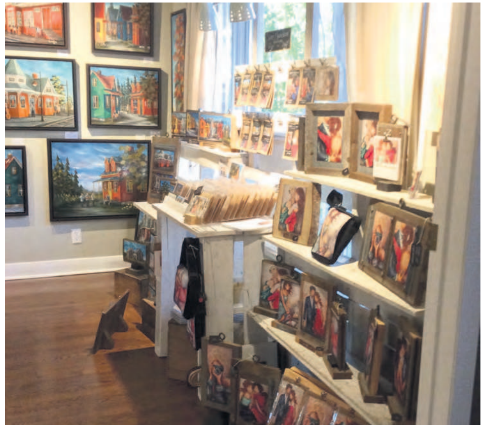
Les produits dérivés sont un complément financier intéressant pour les artistes.

Entre autres produits dérivés, la colorée artiste propose des reproductions d'œuvres, des affiches, des coussins, des sacs, des tabliers, des cartes de souhaits. Sur son site Internet, ils sont disponibles dans la section boutique-cadeaux. Elle poursuit sur le même sujet : « De plus, ils permettent d'encourager plusieurs artistes,