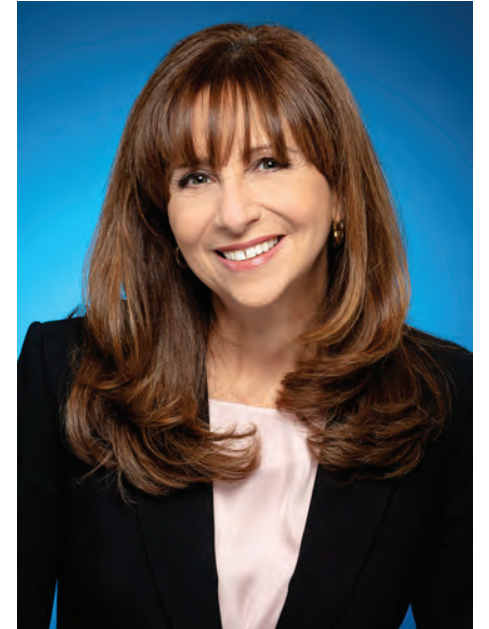
Nathalie Roy, députée de Montarville, ministre de la Culture et des Communications.

Souvent dénoncées par les médias, ces mesures viennent compenser en partie le déclin des revenus publicitaires qui ont eu tendance à