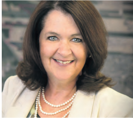
SUZANNE ROY, MAIRESSE DE SAINTE-JULIE

« Les médias locaux sont indispensables. Toute la presse est un élément fondamental de la démocratie. Les médias locaux vivent de la publicité, mais des géants du numérique cannibalisent tous ces revenus. Dans les municipalités, même les commerces locaux souffrent à cause de ces GAFA (Google, Apple, Facebook, Amazon), c'est un autre élément de drainage de la publicité dans les journaux. Est-ce que nos collectivités devraient contribuer en aidant la presse locale, en s'assurant de mettre un pare-feu à l'indépendance des journalistes? Ce qu'il est important de sauvegarder, ce sont les journalistes dont la profession est d'analyser l'information. Le fédéral, quant à lui, n'a pas la volonté d'aller chercher de l'argent auprès des GAFA. Nous sommes pourtant aujourd'hui à un moment crucial et il faut trouver des solutions. Il y a là un enjeu de démocratie. Le média local a un taux de pénétration qu'on ne pourrait pas avoir avec les outils numériques de la Ville. Ça ne me dérangerait pas que le gouvernement oblige de nouveau les municipalités à afficher les avis publics dans un journal local, mais ce n'est pas là que je vois l'avenir de l'aide aux médias. À dire vrai, nous n'avons pas diminué nos annonces dans le journal local, car le but premier est d'informer le plus grand nombre de citoyens. »