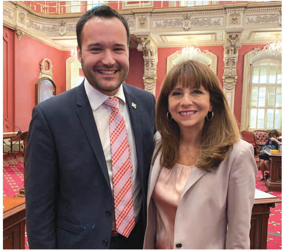
Mathieu Lacombe et sa collègue, la députée de Montarville Nathalie Roy.

Les sommes versées pour ces travaux d'infrastructures contribuent à créer des milieux de vie sains, sécuritaires et stimulants pour les tout-petits. »