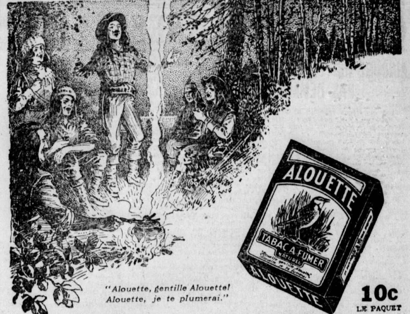
"Alouette, gentille Alouette! Alouette, je te plumerai."

Ainsi chantaient les voyageurs et les coureurs des bois, lorsqu'ils fumaient assis autour du feu, au bon vieux temps du régime français. C'est aussi ce que chantent les hommes de Québec lorsqu'ils fument