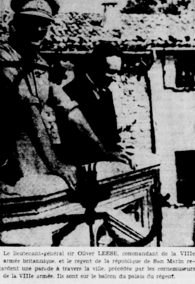
Le lieutenant-général sir Oliver LEESE, commandant de la VIIIe armée britannique, et le regent de la république de San Marin regardent une parade à travers la ville, précédée par les cornemuses de la VIIIe armée. Ils sont sur le balcon du palais du regent.