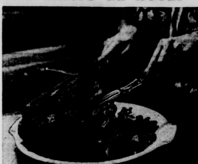
Lorsque vous dépecez un rôti de boeuf dans la croupe, coupez-le sur le travers par tranches d'un quart à trois-huitièmes de pouce d'épaisseur.

Prenez un morceau de rôti de boeuf et cinq à six livres dans la poitrine ou la ronde, coupez-le en morceaux de trois pouces d'épaisseur en-