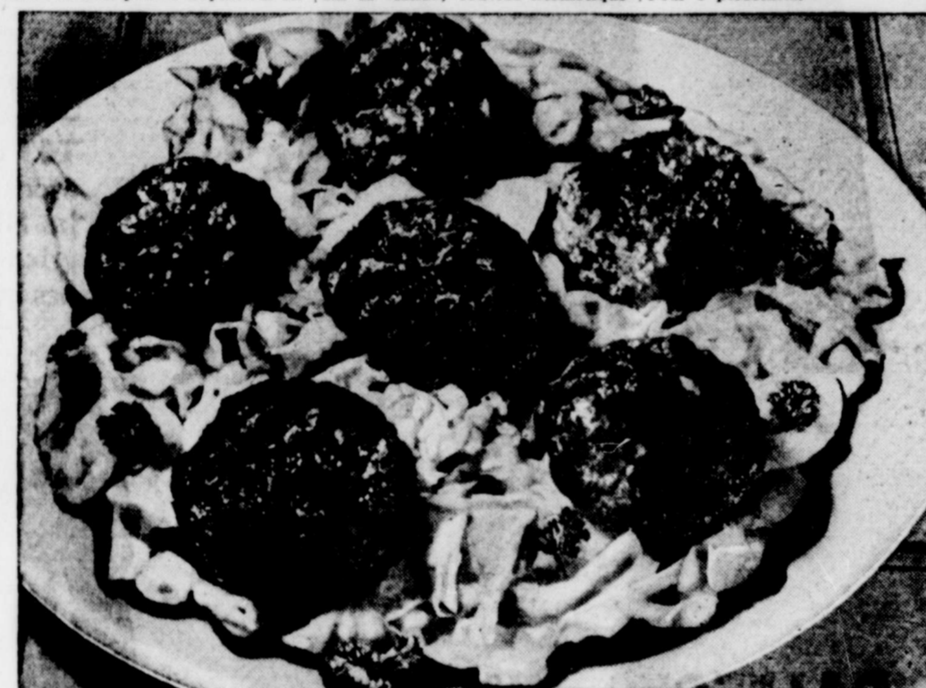
Et voici les boulettes russes à la viande dont la recette apparaît plus haut. Comme vous pouvez en juger, cela paraît très bien, et surtout c'est très bon !

Amenez le vinaigre, l'eau et les épices au point d'ébullition; piquez les clous de girofle dans l'oignon. Retirez du feu, ajoutez 1 cuillerée à thé de sel, laissez tiédir. Pendant ce temps, essuyez la viande, mettez-la dans un pot de grès. Versez la marinade par-dessus, laissez reposer deux jours dans un endroit frais. Vous aurez la précaution de retourner la viande chaque fois que vous passerez près de la jarre. Retirez, asséchez et saupoudrez légèrement de farine. Faites fondre un peu de lard salé dans un chaudron. Saisissez la viande sur tous les côtés. Ajoutez une tasse de la marinade dans laquelle le boeuf a trempé (défaitez-vous de l'oignon), ajoutez la feuille de laurier et les grains de poivre. Mettez une tranche ou deux de lard salé sur la viande; couvrez hermétique-