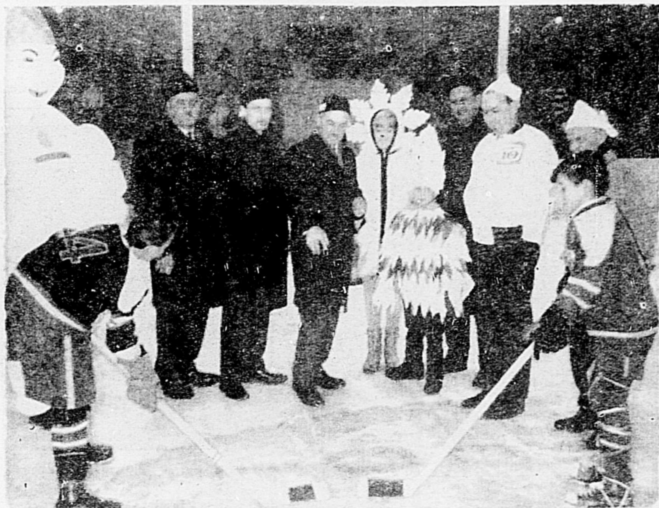
Semaine du hockey mineur