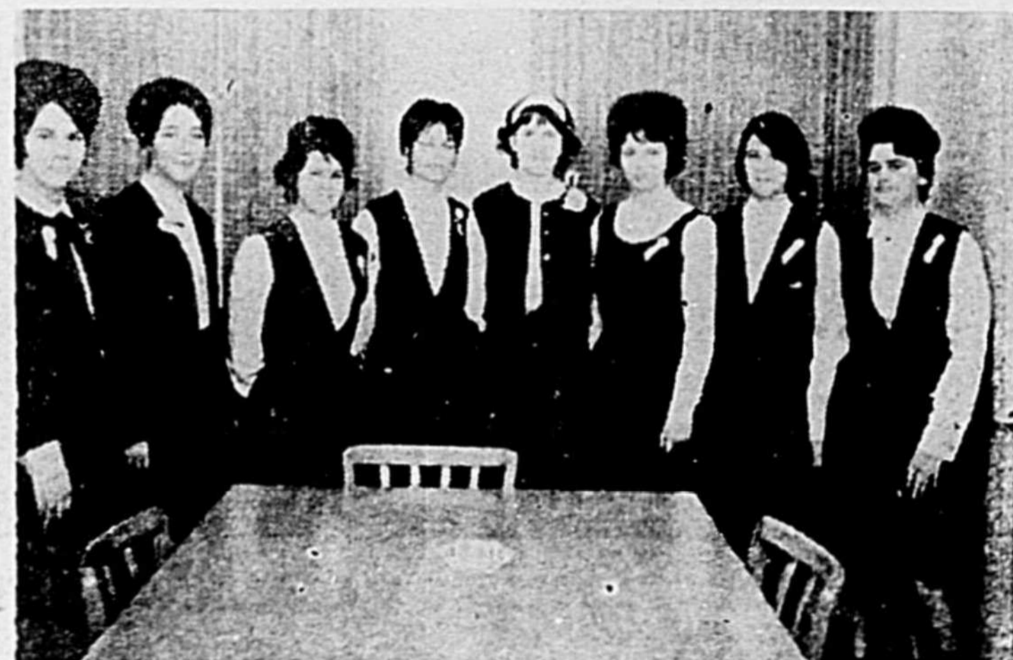
DUCHESSSE DE L'ECOLE SECONDAIRE NOTRE-DAME

Mon Dieu éclaire ma ténèbre; avec toi je force l'enceinte, avec mon Dieu je saute la muraille. (Ps 18, 29-30) (Texte choisi par la Société Catholique de la Bible).