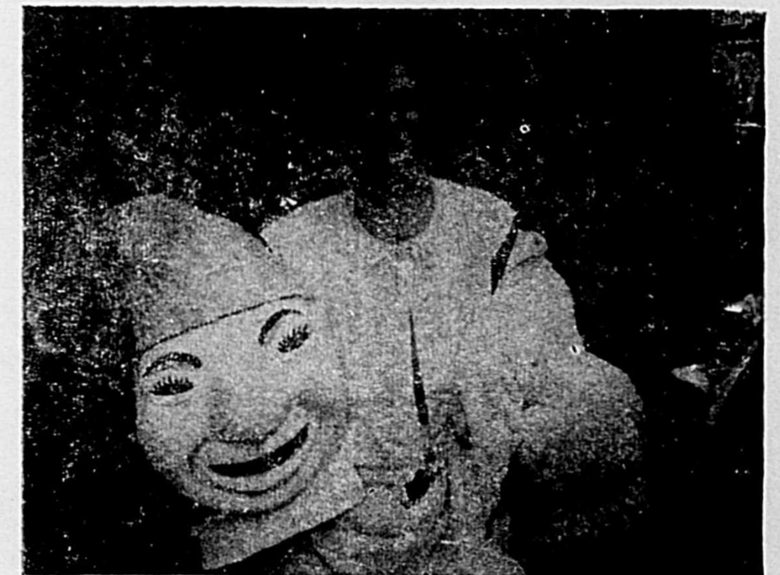
M. Neige s'identifie