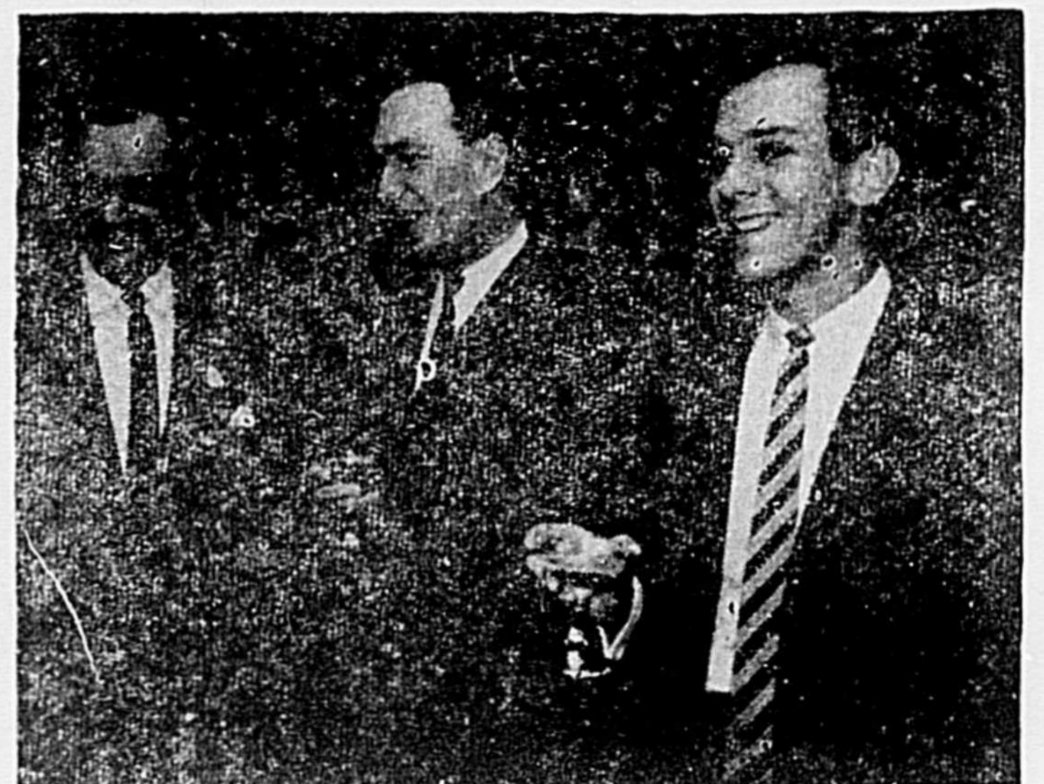
CFTM à Joliette

La Cité de Joliette Service de l'Electricité C.P. 69, Joliette