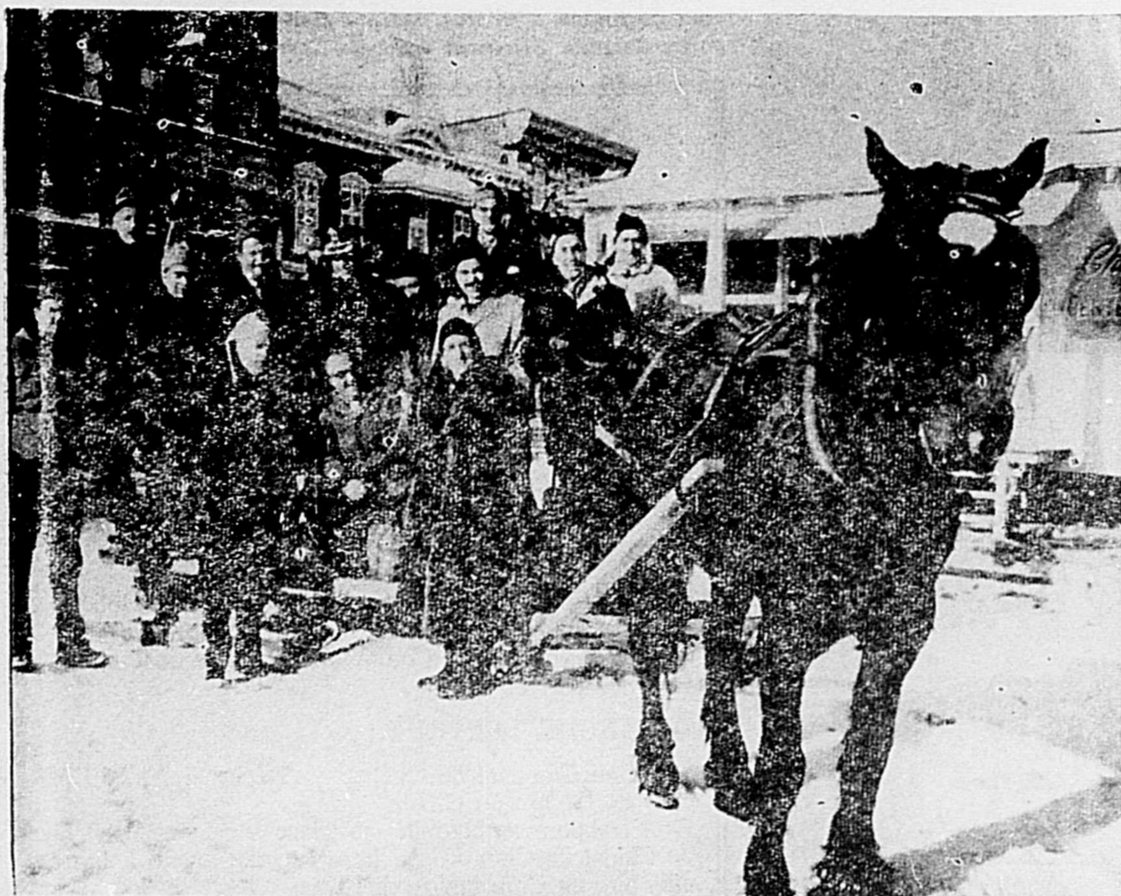
Le cheval du Centenaire!

Les endroits marqués "P" sont les terrains de stationnement gratuit (à côté de la Cathédrale, derrière le Palais de Justice et derrière l'école secondaire St-Viateur).