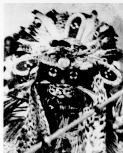
Le vendredi 21 septembre à 8 heures du soir, l'émission radiophonique l'Afrique au jour le jour sera consacrée aux religions et sorciers d'Afrique.