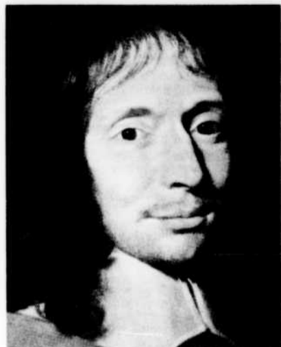
Blaise Pascal, le génial écrivain, mathématicien et physicien dont Jean-Raymond Boudou évoquera la figure à l'émission Arc-en-ciel , le mercredi 19 septembre.