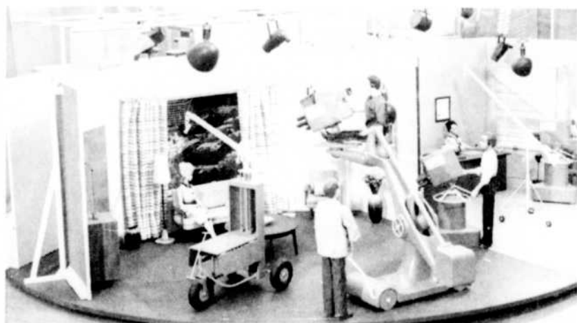
Voici une partie de la maquette d'un studio de télévision exposée dans le hall de l'immeuble Radio-Canada à Montréal, à l'occasion du dixième anniversaire de la télévision au Canada. Des guides sont à la disposition des visiteurs qui veulent se renseigner sur la réalisation d'une émission de télévision.