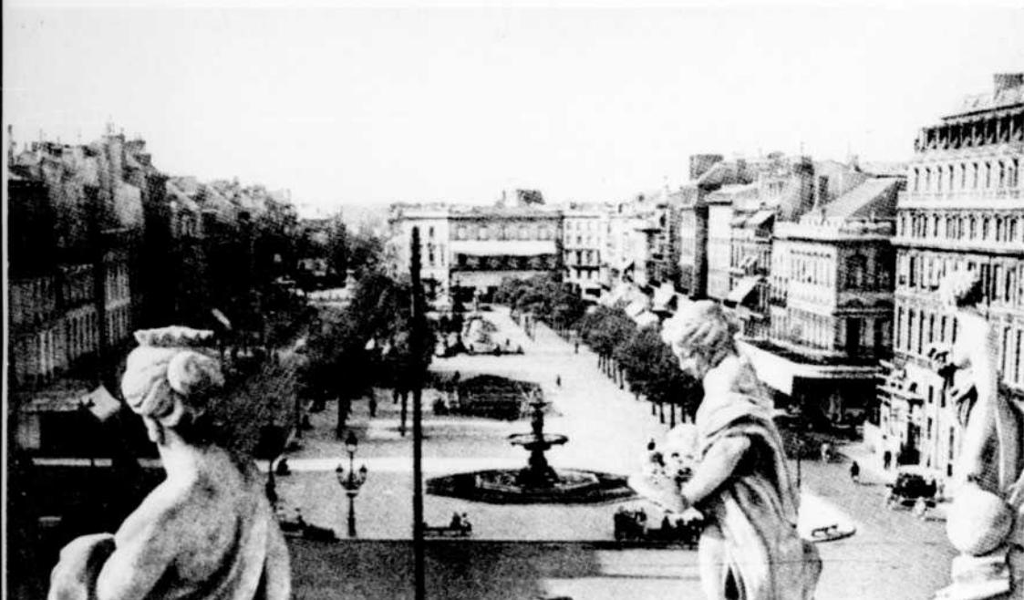
Une rue de Bordeaux, ville située sur l'estuaire de la Gironde et au centre d'une région vinicole. Son festival accueillait, cette année, une exposition d'oeuvres canadiennes.