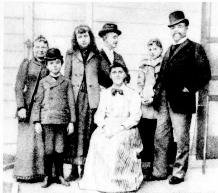
Dvorak et sa famille, à leur arrivée aux États-Unis.