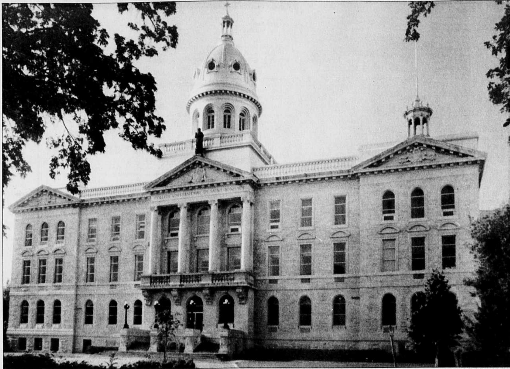
Le Collège universitaire de Saint-Boniface.

« On a réussi à convaincre (les jeunes francophones) de l'importance de faire des études universitaires en français, poursuit Paul Ruest. Le