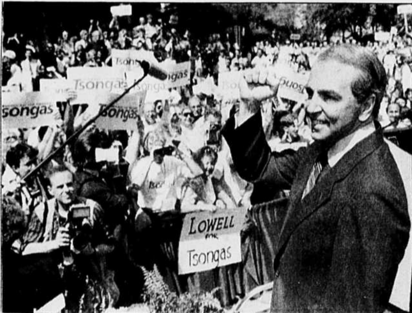
Paul Tsongas, démocrate, faisant campagne en Floride.