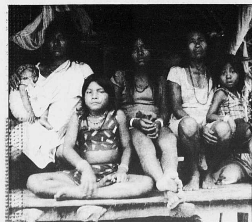
UNE SCÈNE DE Sous les grands arbres , de Michel Régnier.

«Ici, la forêt habite l'homme autant qu'elle l'abrite et le nourrit». On dirait que tout le film de Régnier est construit autour de cette phrase exprimant l'enracinement séculaire d'être qui posent sur nous des regards intelligents, presque tendres. Il nous donne le privilège de goûter le repos dans une oasis, comme pour mieux laisser entendre que le tohu-bohu qui a cours en Amazonie n'a pas touché les Huni Kui. Disparition de espèces végétales et animales, destruction de forêts que l'homme n'arrive pas à réaménager, persécution de groupes jugés réfractaires à la percée d'autoroutes ou à l'industrie de l'élevage et à tant de tentatives pour éponger une dette contractée envers les mêmes puissances qui ont profité durant un siècle du «boom» du caoutchouc? Bien sûr que cela existe, mais Régnier, cette fois, résiste à la tentation de nommer le désordre; mieux, il nous en présente l'antithèse, presque en se taisant, ce qui relève de l'exploit.