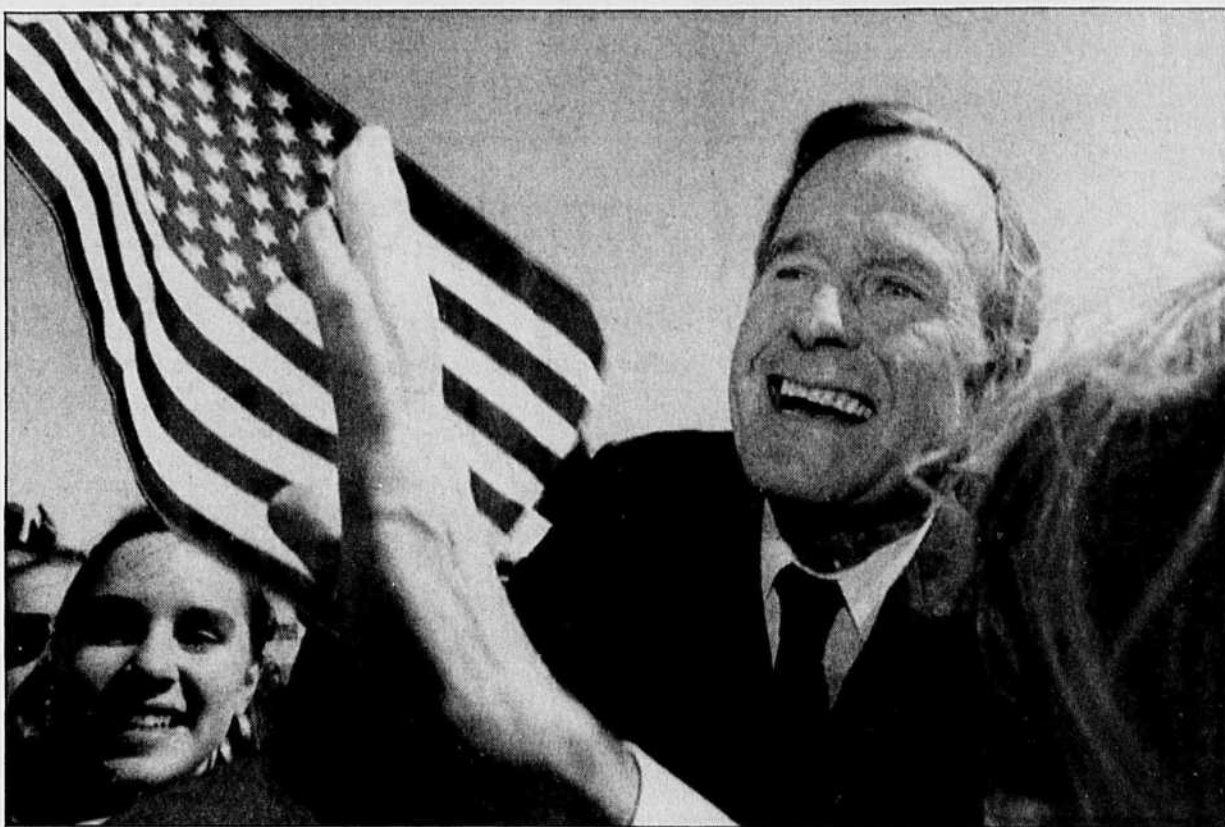
George Bush en campagne en Géorgie.