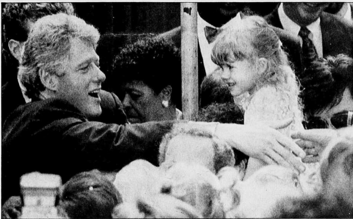
Le candidat démocrate Bill Clinton.