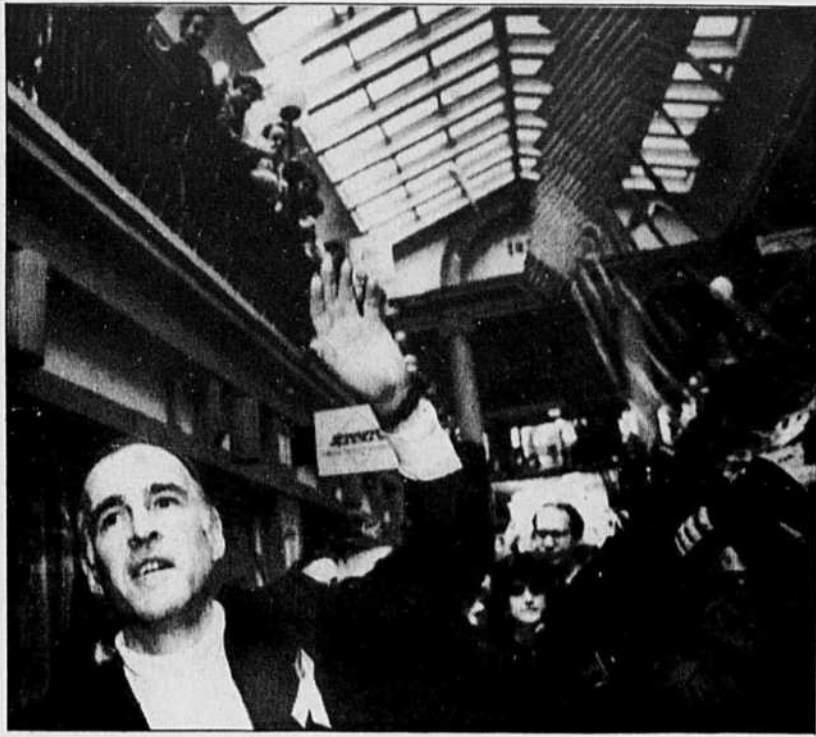
Jerry Brown, candidat à l'investiture démocrate.