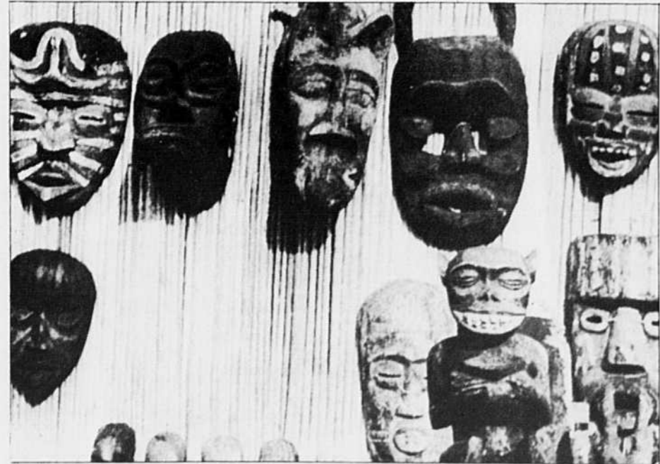
Marché aux fétiches à Lomé.