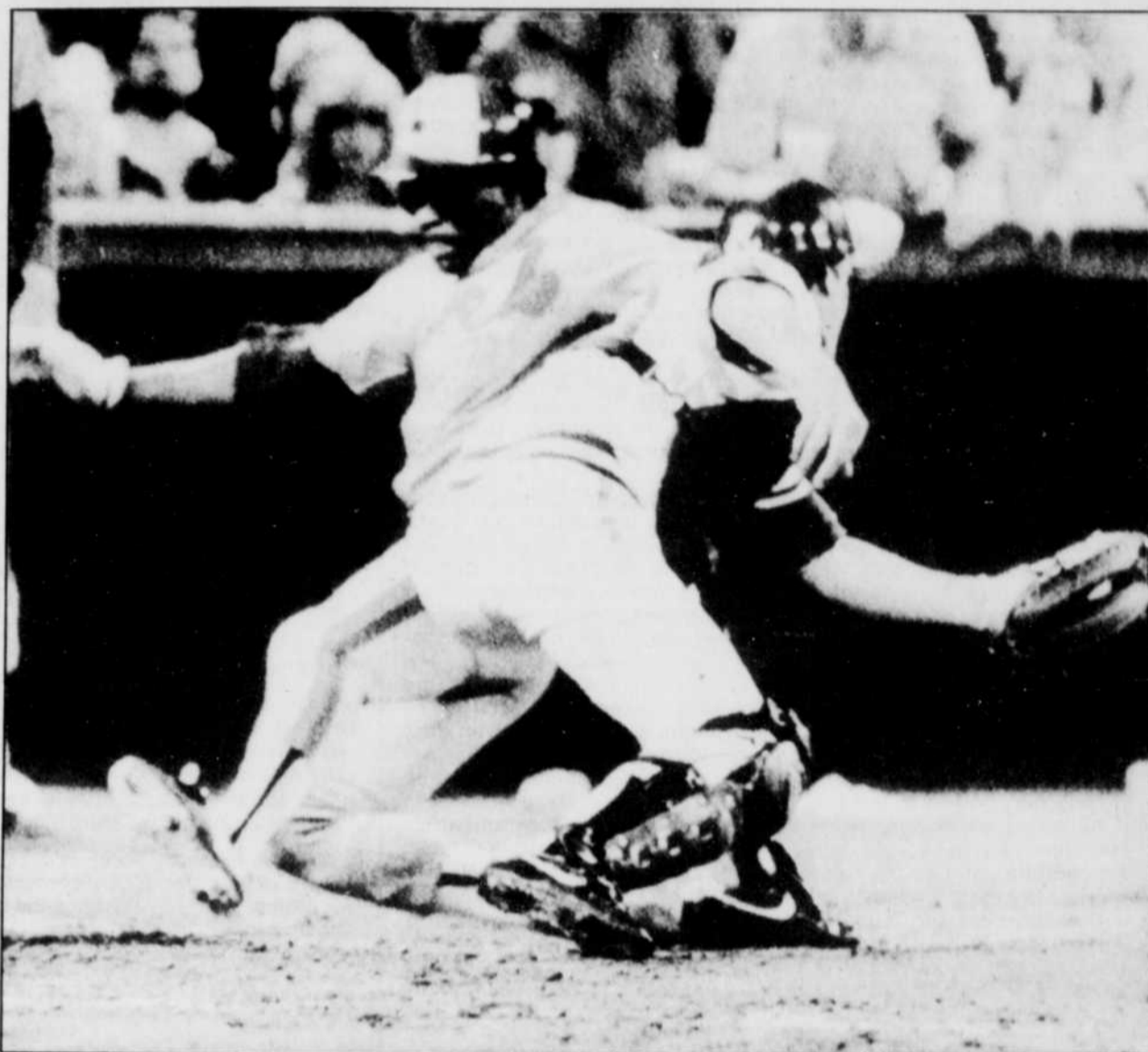
Tim Raines a croisé le marbre sur le simple de Cromartie après avoir inscrit son 8e larçin.

Rogers s'est également illustré à l'attaque, produisant le deuxième point des siens, à la deuxième reprise, à l'aide d'un simple qu'il a réalisé après deux retraits.