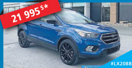
21 995 $* 2018 FORD ESCAPE SE Black Édition, Traction intégrale, automatique LOOK INCROYABLE, À VOIR! | 8 556 KM