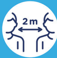
Gardez vos distances