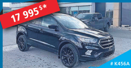
17 995 $* 2017 FORD ESCAPE SE AWD, toit panoramique, Black Édition, traction intégrale RARE! AUTOMATIQUE | 67 928 KM