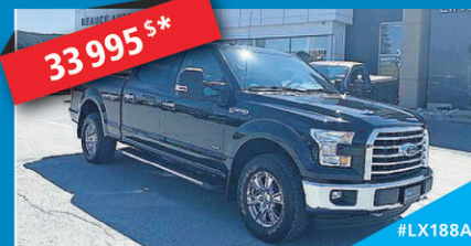
33 995 $* 2017 FORD F-150 XLT SUPERCREW Moteur 3.5L EcoBoost, ensemble de remorquage Max, caméra de recul, Bluetooth AUTOMATIQUE | 65 775 KM