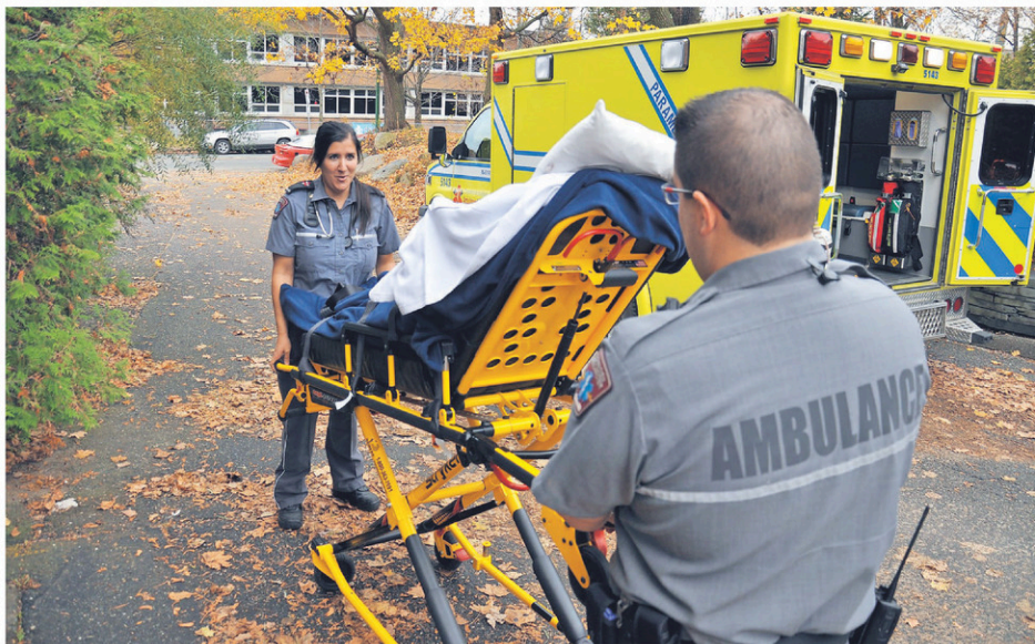
Le programme de Soins préhospitaliers d'urgence sera lancé à l'automne 2021.