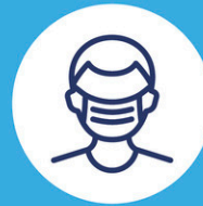
Portez un masque (si à moins de 2 mètres)

On lâche pas. On continue de se protéger.