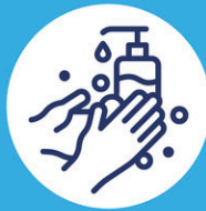
Lavez vos mains