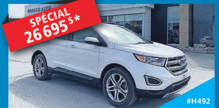
SPÉCIAL 26 695 $* 2017 FORD EDGE TITANE Traction intégrale, moteur ecoBoost de 2L à double entrée, système de navigation à commande vocale SAUTEZ SUR L'OCCASION! AUTOMATIQUE | 24300 KM

NOUS SOMMES À LA RECHERCHE DE VÉHICULES USAGÉS!