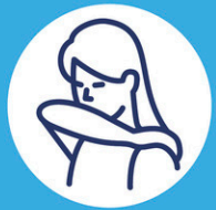
Toussez dans votre coude

Le port du couvre-visage est recommandé lors d'une consultation. Il peut toutefois vous être demandé de le remplacer par un masque de procédure à l'arrivée.