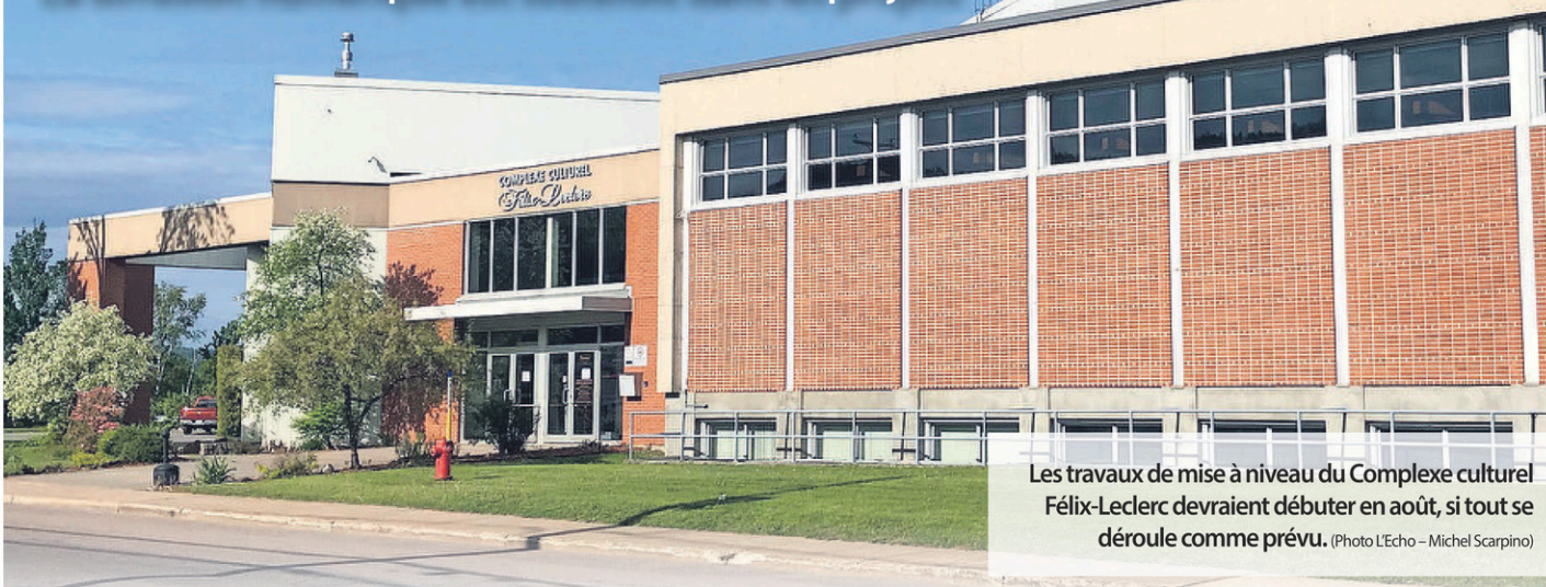
Les travaux de mise à niveau du Complexe culturel Félix-Leclerc devraient débuter en août, si tout se déroule comme prévu.

La diffusion numérique est toutefois dans les projets