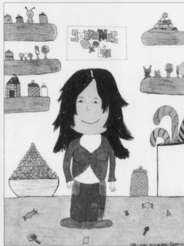
À partir du haut, dans le sens des aiguilles d'une montre, les dessins de Marika Beaudoin-Landry, de Luc Vaillancourt, de Sandra Desjardins et de Léa Laure Bergeron-Dennie