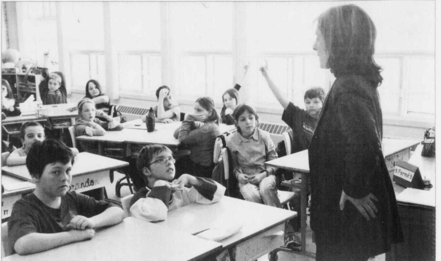
La formation « Vers le pacifique » a débuté à l'école du Bac au mois d'octobre, à raison d'un atelier tous les neuf jours, échelonnés sur toute l'année.