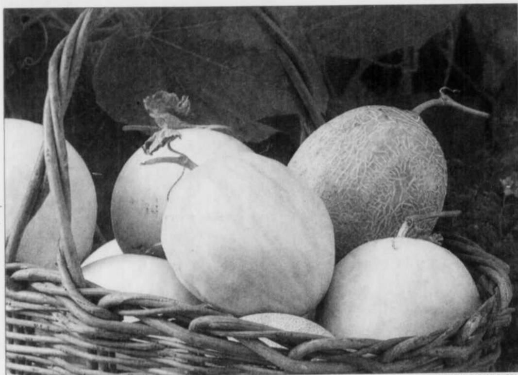
Trois des melons les plus connus: melon broché, melon miel et melon canari.

Le melon fut longtemps considéré comme une plante bien marginale au Québec, car il demandait une très longue saison de culture. On se souvient du «melon de Montréal», produit près de la ville du même nom et qui ne pouvait se cultiver que dans les régions les plus chaudes de la province. Maintenant très rare, ce melon fut très populaire jusque dans les années 1960. De nos jours, cependant, on a réussi à développer des melons hâtifs,