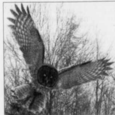
Magnifique cliché d'Éric Scullion de Saint-Romuald d'une chouette lapone en plein vol.

sans succès. La tourterelle avait beau lui foncer dessus, lui effleurer la tête, il n'a jamais lâché prise.