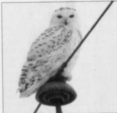
Un harfang des neiges, photographié à Rivière-Ouelle. C'est un coin où on en retrouve chaque hiver.