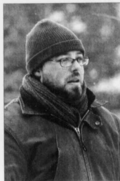
Francis Leclerc a aussi réalisé «Une jeune fille à la fenêtre», en 2001.