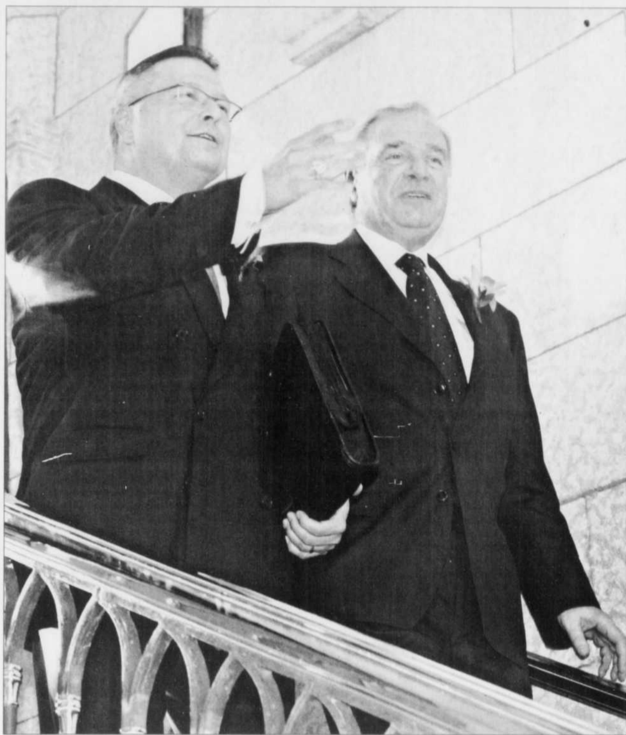
Ralph Goodale a fait connaître son premier budget fédéral cette semaine.

Au TVA de 18 h du 22 février, M re Marc Ouellet se plaisait à redire que, depuis le déclin de l'aveu individuel des péchés, les personnes vont rencontrer les psychiatres pour compenser. Penser justifier l'aveu individuel des fautes en faisant une telle affirmation est pour le moins surprenante. Elle est d'autant plus étrange que la confession avec aveu individuel des fautes est offerte pour les personnes qui le désirent. Alors pourquoi vont-elles rencontrer le psychiatre ou le psychologue? J'aimerais rappeler à M re Ouellet que dans les