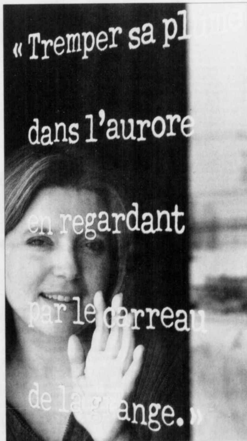
Partout, l'esprit de Félix Leclerc est présent à travers sa poésie.