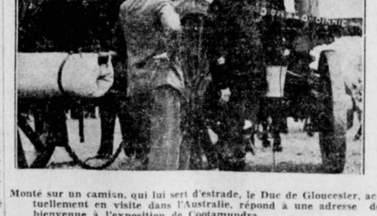
Monté sur un camion, qui lui sert d'estrade, le Duc de Gloucester, actuellement en visite dans l'Australie, répond à une adresse de bienvenue à l'exposition de Coolambra.

Un an plus tard, elle remporta une victoire sur madame May Heilzig qui détenait le record de la vitesse chez les aviatrices. Elle conduisit son avion à une vitesse de 290,6 à l'heure sur un parcours de trois kilomètres. Elle détenait aussi le record des milles kilomètres avec une vitesse moyenne de 253 1/2 milles à l'heure.