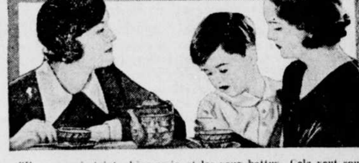
"Il a mauvais teint, chère amie, et les yeux battus. Cela veut souvent dire qu'un enfant a besoin d'un laxatif. Donnez-lui du Castoria ce soir..."