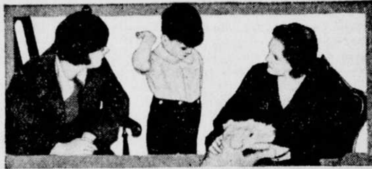
"Pierrot, tu n'as pas honte de faire mal au pauvre Médor? Ce gamin m'inquiète, ma chère... Il refuse de jouer — de manger — il est toujours boudeur..."