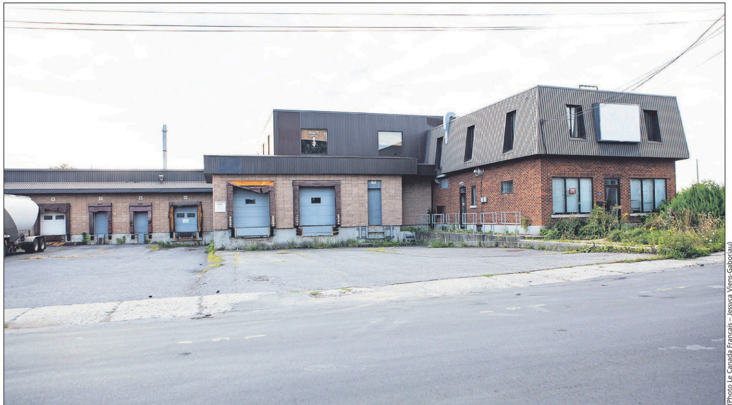
La démolition de l'usine et la construction des nouveaux logements ne devraient pas commencer avant un an.