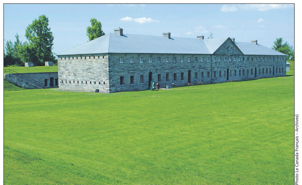
Rappelons que le lieu historique national du Fort-Lennox est fermé cette année, de même qu'en 2019 pour mener des travaux majeurs de conservation.

La caserne est le bâtiment le plus emblématique du fort Lennox. Il s'agit d'un important ouvrage de maçonnerie de 74 mètres de long sur 15 mètres de