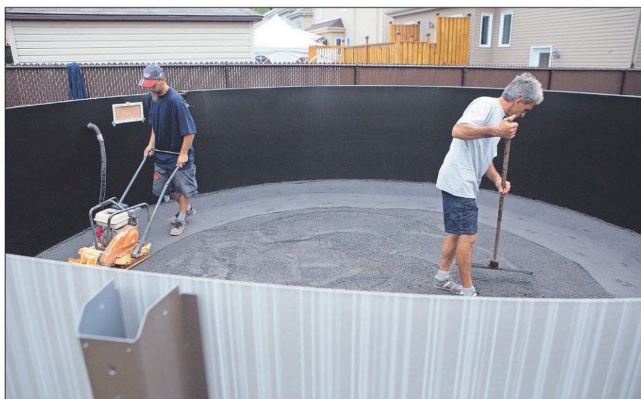
Hausse des ventes, saison décalée en raison des sols détrempés... les installateurs de piscines n'ont pas chômé cet été!