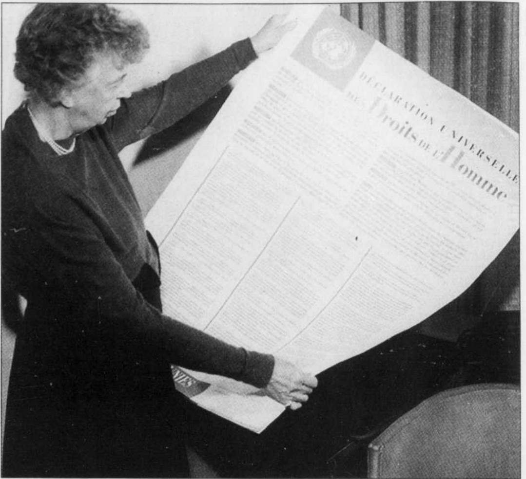
Mme Eleanor Roosevelt tenant la Charte des Droits de l'Homme.

Le délégué russe avait ouvert le feu du bloc slave contre la déclaration, jeudi soir. Le délégué américain, Mme Franklin D. Roosevelt, lui avait répondu plus tard, lui demandant de coopérer et d'accepter le désir de la majorité.