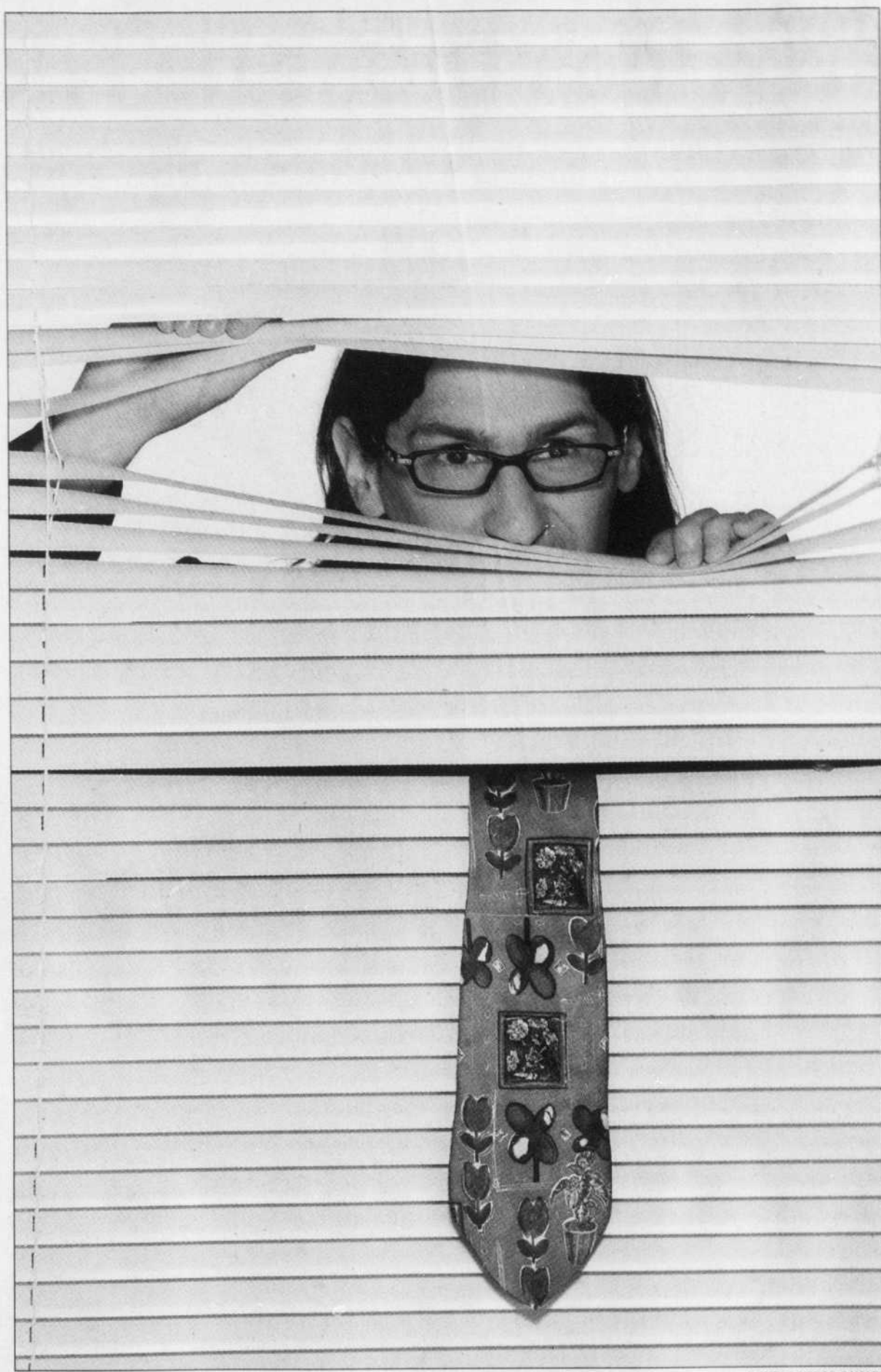
Infoman lui-même, Jean-René Dufort, un des nombreux visages de l'infotainment.