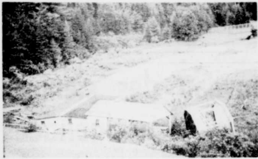
Cette photo laisse voir l'aspect du terrain de l'OTJ d'East Angus, le lendemain de l'inondation qui a rendu ce terrain impraticable. Nous pouvons voir à la surface du terrain une couche de boue d'une épaisseur de cinq pouces qui a été entraînée par la force du courant.