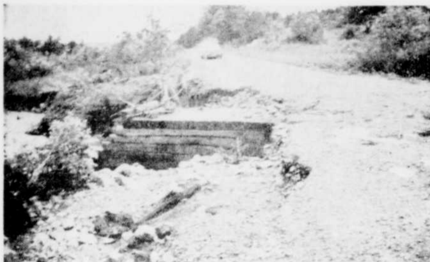
LE DEUXIÈME PONT SITUÉ au Big Hollow, à East Angus, a été miné par l'eau et le chemin n'est pas carrossable sur la moitié de sa surface. Ces dommages ont été causés par la tempête de samedi soir et un autre pont sur la propriété de M. Pomerleau, a également été entraîné par l'inondation.