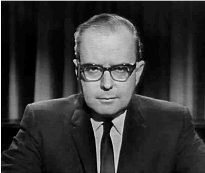
Captation de la conférence «Genèse et historique de l'idée séparatiste au Canada français» du 25 mars 1962 diffusée à Radio-Canada et conservée au Centre d'archives Gaston-Miron