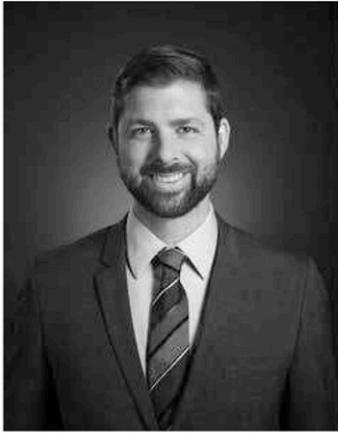
Xavier Barsalou-Duval Député de Pierre-Boucher—Les Patriotes—Verchères