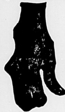
Difformité dans le rhumatisme chronique

Je vous enverrai gratuitement une boîte de 50 centins de mon remède.