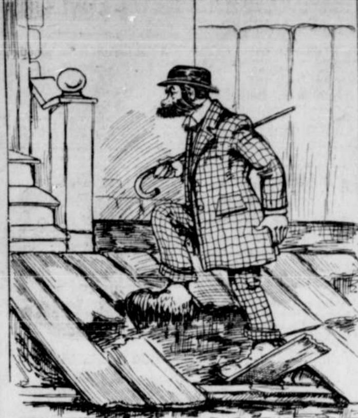
Le citoyen — C'est vrai qu'on va avoir un beau Champ de Mars.

Québec, 14. — Le vapeur "Ben-gore Head", qui s'est échoué le 5 octobre à Plover Cove, est arrivé dans notre port, hier après-midi. On fera l'inspection de sa coque, aujourd'hui.