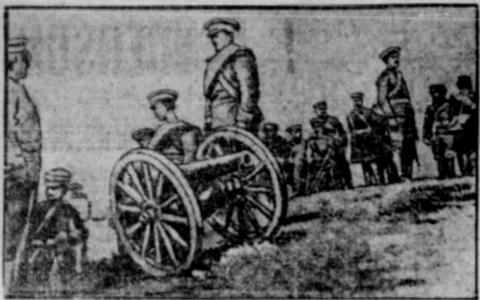
SOLDATS BULGARES A LA FRONTIERE DE LA TURQUIE.