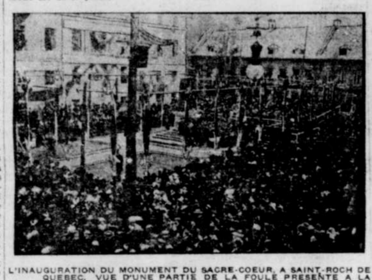
L'INAUGURATION DU MONUMENT DU SACRE-COEUR, A SAINT-ROCH DE QUEBEC, VUE D'UNE PARTIE DE LA FOULE PRESENTE A LA CEREMONIE.

Le curé Lagueux a rendu un bel hommage aux pieux citoyens qui ont eu l'idée de cette belle manifestation du Sacré-Coeur pour lequel la paroisse de Saint-Roch a toujours eu une dévotion très vive, et il a remercié chaleureusement tous ceux qui, de près ou de loin, ont contribué à l'érection de ce monument.