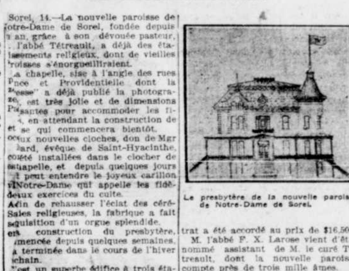
Le presbytère de la nouvelle paroisse de Notre-Dame de Sorel.

Fondée depuis un an seulement, elle compte déjà de magnifiques établissements religieux, qui font son orgueil. — La chapelle temporaire. — Un carillon. — Le presbytère sera bientôt terminé.