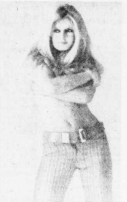
Si Brigitte Bardot continue, nous n'aurons bientôt plus rien à nous mettre sur le dos et sous la dent!

de l'industrie mondiale de la fourrure naturelle. Il y a beaucoup de personnes comme elles, bien intentionnées mais mal informées, qui ne possèdent pas les données et les connaissances suffisantes en biologie et qui causent des torts immenses à une saine gestion du patrimoine faunique international. Peut-être qu'elle fêtera sa victoire en dégustant un carré d'agneau, ou du poulet sur le grill, ou un homard ébouillanté vivant, ou une côtelette de porc, ou un filet mignon de bœuf; si elle est végétarienne, elle s'enverra derrière sa magnifique gorge quelques crudités provenant de plantes fraîches et... vivantes! Il y a des gens comme elle qui parlent de protéger "l'écologie du milieu", mais qui oublient que l'être humain fait partie de... l'écosystème! Dès que notre ancêtre Adam a commencé à bouger le bout de son gros orteil, il venait de "modifier" l'écosystème! Et ça fait déjà quelques "lunes" de ça. Et c'est un Etre supérieur qui avait pourtant créé Adam et Eve... ou Brigitte! Cet Etre devait quand même avoir une maudite bonne raison pour agir de la sorte! Et cet Etre devait savoir ce qu'il disait lorsqu'il affirmait à Adam et Eve que la création (nature et animaux) était à leur service.