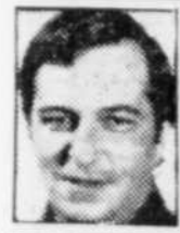
André Bellemare Chasse et pêche

Un jugement rendu à Joliette, avant-hier, par le juge François Beaudoin de la cour des sessions de la paix, pourrait causer un problème de taille pour les quelque 60 ZEC du Québec, s'il était éventuellement maintenu par la cour d'appel.