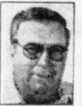
la chronique de Sab

Il faudrait une véritable malchance, pour ne pas dire une catastrophe, pour empêcher les clubs Angevins de Bourassa et Des Gouverneurs de Sainte-Foy de faire les frais de la série qui décidera des représentants du Québec au prochain tournoi canadien de hockey midget Air-Canada, qui a lieu cette année dans notre région.