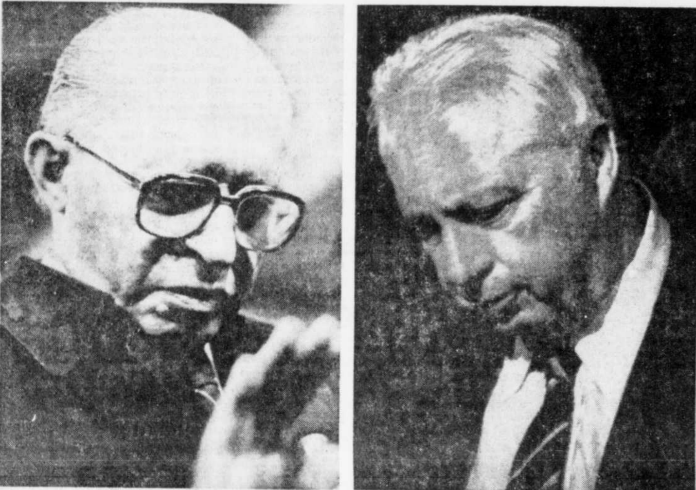
Le premier ministre Menahem Begin (à gauche) et le ministre de la Défense, Ariel Sharon, ont été les derniers à quitter la salle du cabinet des ministres. Tous deux ont commenté l'attentat à la grenade. Pour Menahem Begin, il n'y avait plus d'autres questions à poser...

Les militants du rabbin Kahana, groupés dans la "Ligue de défense juive", implantée aux Etats-Unis et dans une moindre mesure en Israël, ont déjà été à l'origine d'incidents violents en Cisjordanie et à Jérusalem, rappelle-t-on. Plusieurs d'entre eux avaient menacé de se suicider à Yamit (dans le Sinaï) en avril 1982 pour tenter d'échapper la restitution du Sinaï à l'Egypte par Israël.