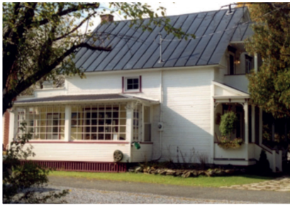
Le presbytère d'Émileville aujourd'hui