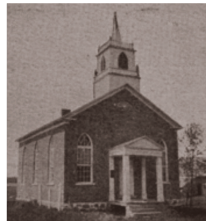
Première église d'Émileville (1856)

(Lafleur). Malheureusement, l'école disparaîtra dans un incendie en 1854 et sera relocalisée l'année suivante à Longueuil.