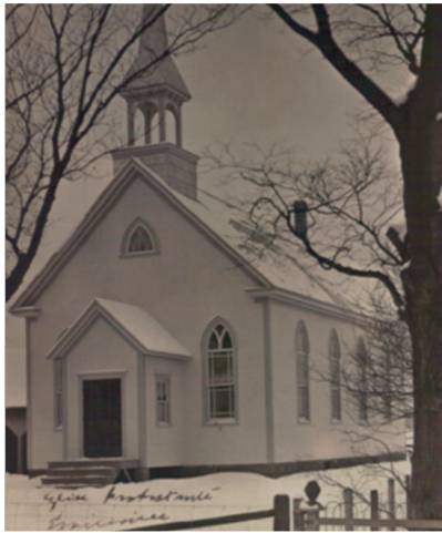
La deuxième église d'Émileville (1909)