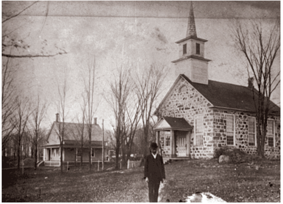
L'église baptiste de Roxton Pond et son presbytère à la fin du XIX e siècle

Ce n'est qu'en 1878 qu'on y enterrera quelqu'un d'autre, et les stèles suivantes remontent aux années 1880, même si le cimetière de Roxton Pond, situé dans la village à quatre kilomètres, semble en activité dès 1871. La proximité de l'emplacement explique peut-être que l'on choisisse l'un plutôt que de l'autre, d'autant plus que