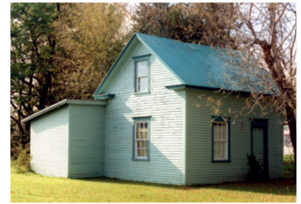
Ancienne école d'Émileville aujourd'hui