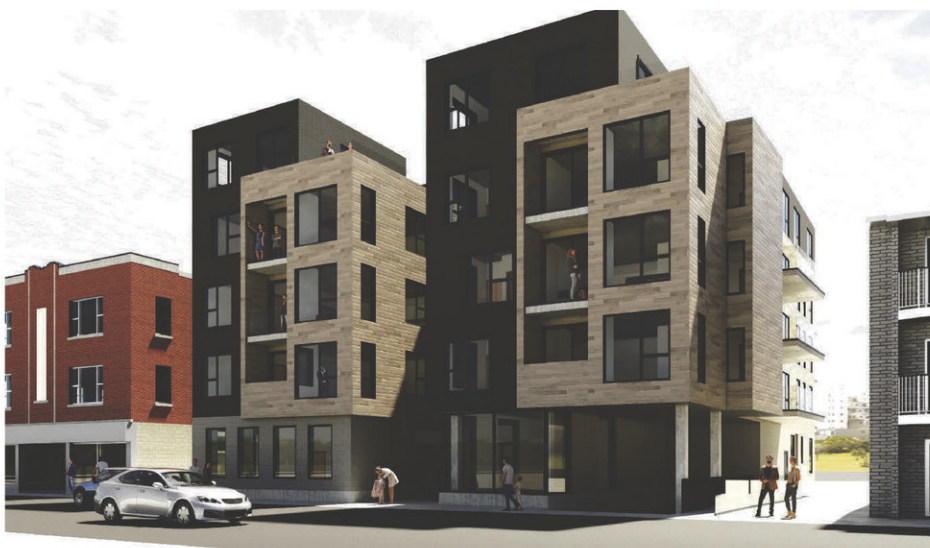
La maquette du projet proposé.