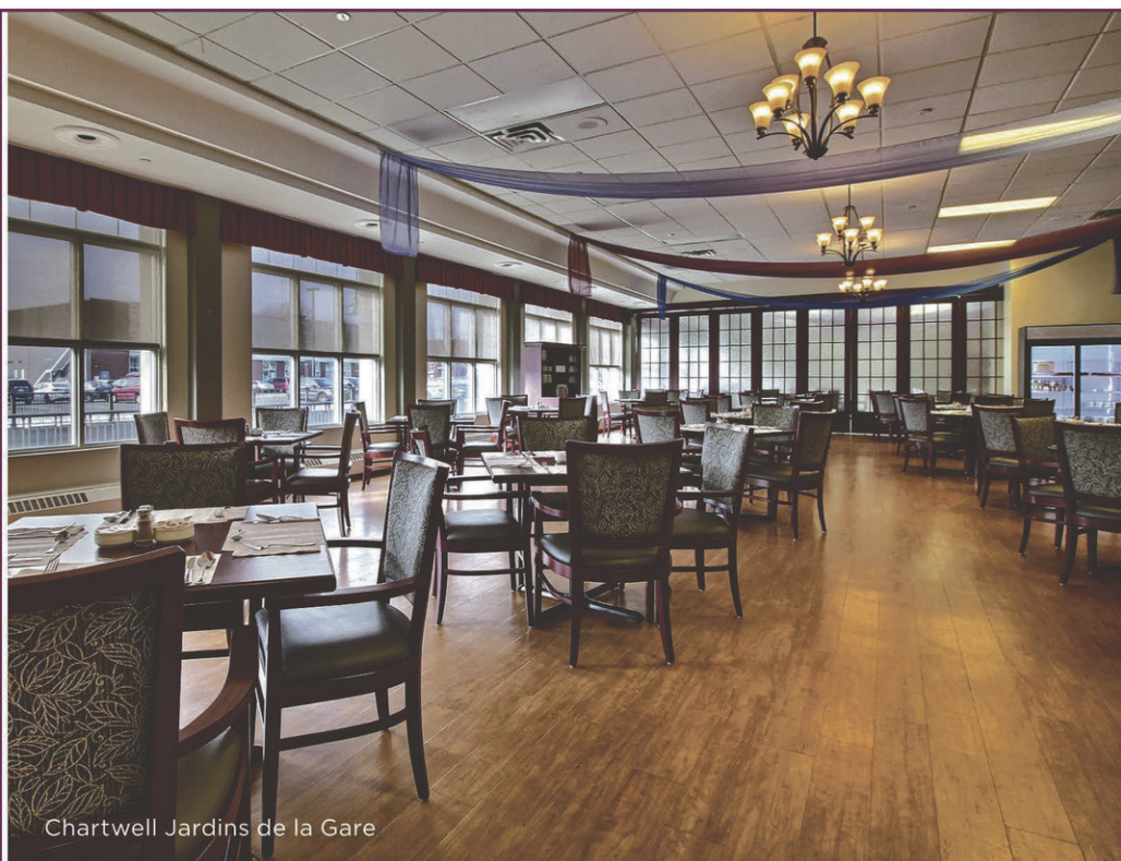
Chartwell Jardins de la Gare

Planifiez une visite dès aujourd'hui! 1 844 478-6473 | Chartwell.com