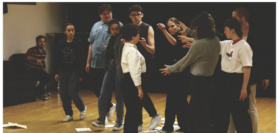
Les finissants de l'École de théâtre du Cégep de Saint-Hyacinthe en pleine répétition de leur première pièce de la saison qui sera présentée du 21 au 27 octobre à la salle Léon-Ringuet.