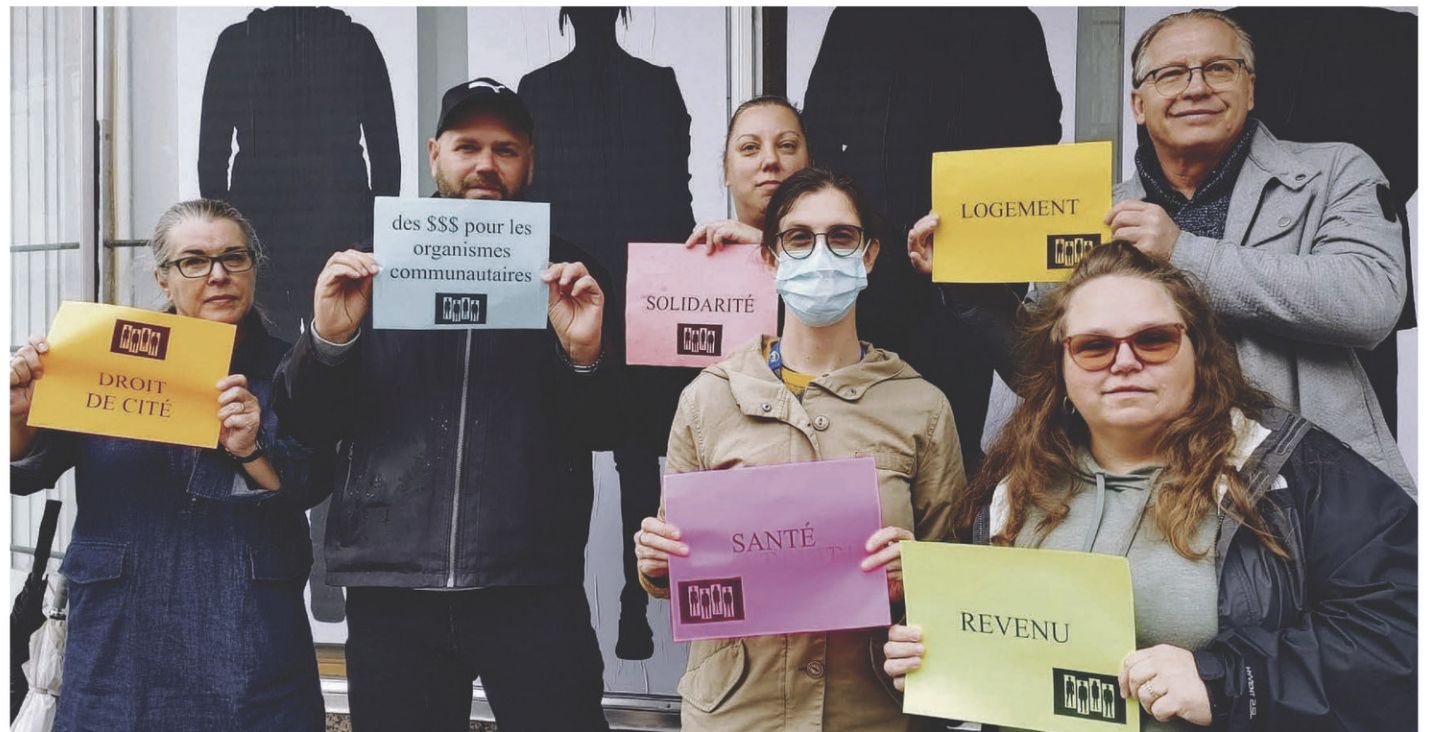
Le comité organisateur de la Nuit des sans-abri invite les citoyens à se présenter en grand nombre au parc Casimir-Dessaulles le 21 octobre.