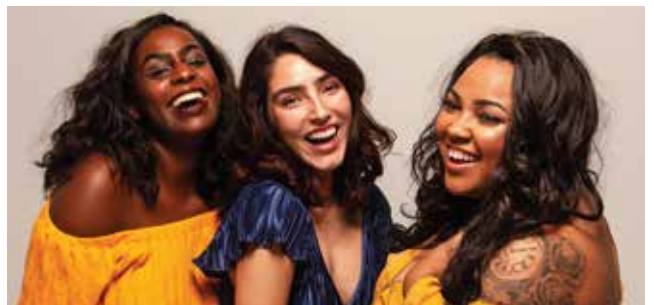
CÉLÉBRER LES FEMMES

et gère une fondation qui fournit un soutien financier aux organisations venant en aide aux femmes et aux filles. S'engager avec un large éventail de femmes et utiliser votre pouvoir d'achat est un moyen simple de participer. Visitez www.lavieenrose.com/fr/ensemble-pour-les-femmes .