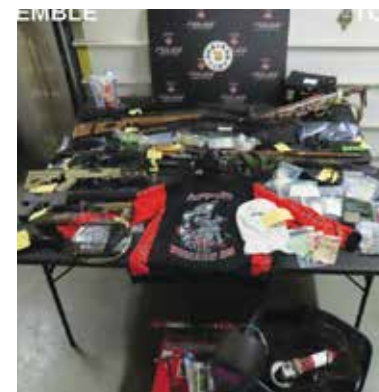
Une importante saisie de drogues, d'armes et d'argent a eu lieu dans la région de Haut-Madawaska.

Le Groupe intégré de l'application de la loi du Nouveau-Brunswick est composé de membres de la GRC et de services de police municipaux, ainsi que d'employés du ministère de la Justice et de la Sécurité publique de la province. Leurs efforts visent à intervenir de manière plus coordonnée afin de