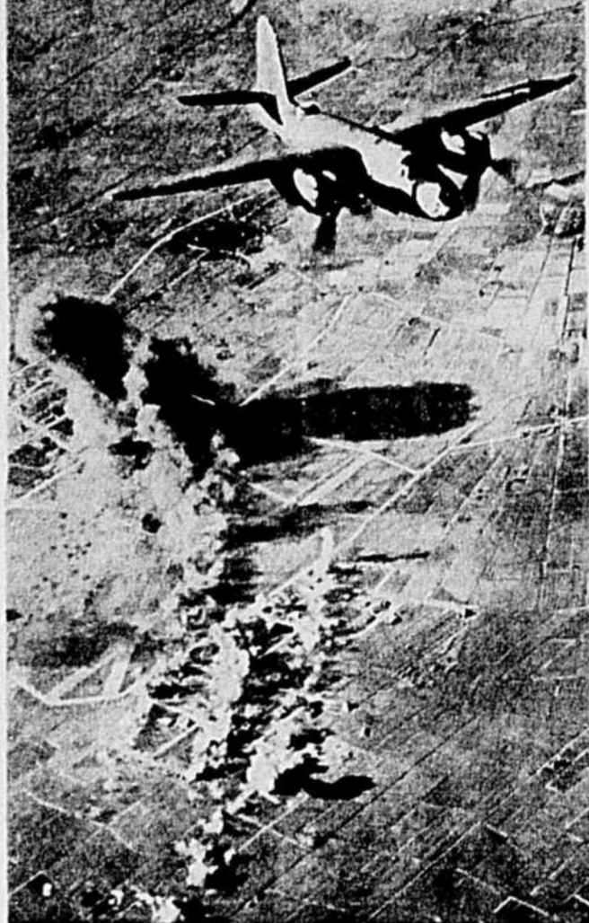
Au-dessus du territoire propre et serin de la Hollande, un "Marauder" B-26 laisse tomber ses cargaisons de bombes. Un aérodrome allemand est la cible. On voit au haut l'avion qui vient de lancer ses projectiles. Ceux-ci ont éclaté sur le sol.