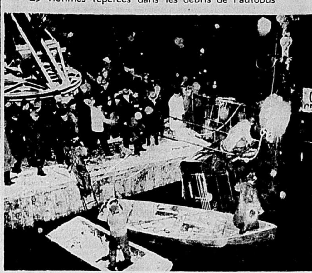
Des scaphandriers et des membres d'équipes de secours ont travaillé avec acharnement, en dépit d'un grésil aveuglant, puis d'une tempête de neige, à la surface des passagers d'un autobus qui a plongé dans la glace, dont le pont était recouvert, et avait passé 23 cadavres dans l'autobus. Sur cette photo, on voit l'arrière du véhicule qu'une puissante grue, montée sur une barge, est à soulever au-dessus de l'eau. Une autre grue est installée sur le pont.