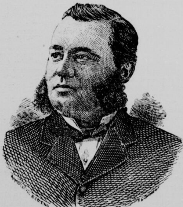
JOSEPH O. VILLENEUVE, DÉPUTÉ (CONSERVATEUR) DU COMTÉ D'HOCHÉLAGA