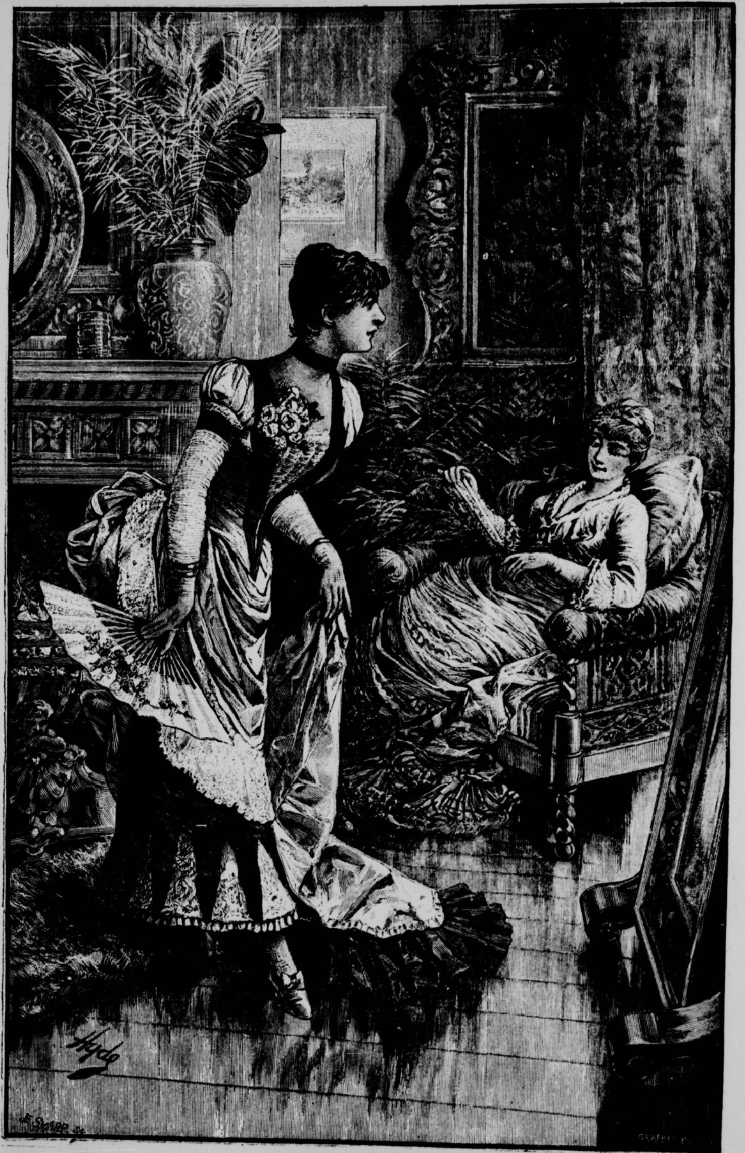
COMMENT SUIS-JE ?.....