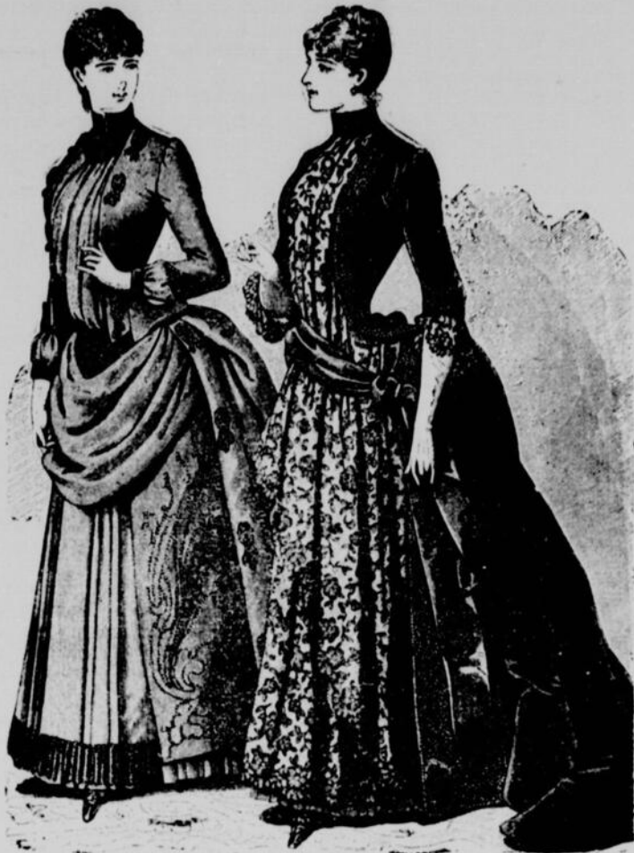
No 1. Toilette en sicilienne et velours. No 2. Toilette en velours et dentelle.

No 1.—Toilette en sicilienne, velours, gaze et passementerie de jais, vue devant et de côté. Cette toilette se compose d'un tablier plissé de trois plis couchés et un gros pli creux ; le côté droit de la jupe est continué comme le tablier, le dos est formé de gros plis creux. Un panneau de drap brodé, est posé à gauche sur la jupe, il est arrêté sous le premier pli creux du dos, sur lequel sont posées quatre belles appliques de jais. Une frange de jais garnit le bas du tablier. Une écharpe de sicilienne est drapée haut sur le tablier et arrêtée sur les hanches. Un lé de sicilienne, posé sur le côté droit et passant sous l'écharpe relevé légèrement sous une bande de sicilienne arrêtée sur le lé par des motifs de passementerie. Dos de tunique continue et le lé du côté droit et relevé entièrement en arrière de la hanche gauche. Corsage ouvert largement sur un plastron de gaze arrêté dans le haut, sous une hausse col de velours brodé, et dans le bas sous une large ceinture également en velours brodé. Les bords du devant du corsage sont ornés de motifs de passementerie. Collet de velours. Manches demi-longues, avec revers de velours brodés. Manches de gaze froncées ; sous la manche poignet de velours.