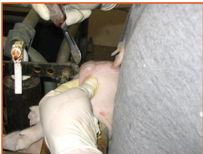
Contention du porcelet dans un dispositif prévu à cet effet et pression sur le scrotum pour bien faire ressortir les testicules

Le but de la castration est d'éliminer l'odeur sexuelle de verrat qui pourrait se retrouver dans la viande de porc mâle non castré et aussi pour réduire les comportements agressifs et les problèmes de manipulation associés aux mâles non castrés 9 .