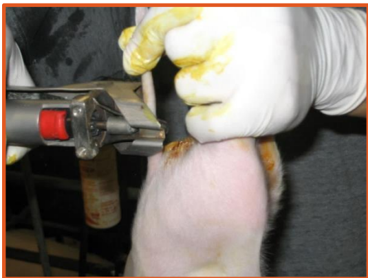
Caudectomie effectuée à l'aide d'une pince au gaz qui permet de couper et de cautériser la queue des porcelets de moins de 7 jours

La coupe de la queue permet de diminuer les risques de morsures de queue (caudophagie) entre des congénères qui partagent le même espace de vie. Toutefois, cette intervention n'élimine pas complètement le problème 6,21 .