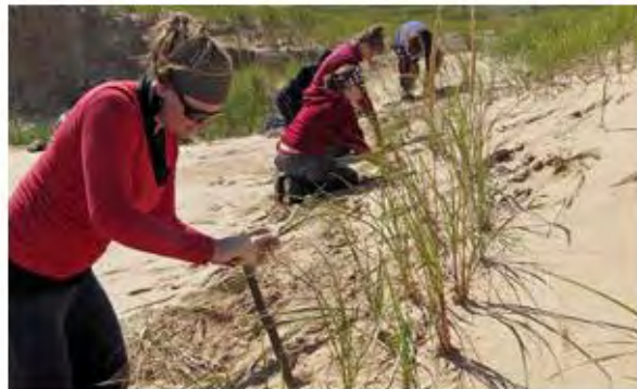
Chercheurs et bénévoles madelinots se livrent à une plantation d'ammophiles, qui s'enracinent dans les dunes.