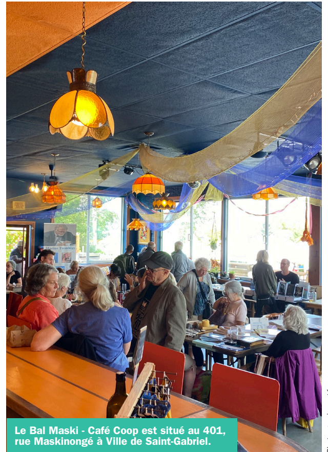
Le Bal Maski - Café Coop est situé au 401, rue Maskinongé à Ville de Saint-Gabriel.

C'est grâce au soutien financier de ses partenaires ainsi qu'à l'incalculable contribution de ses bénévoles que le Bal Maski peut tenir ces activités culturelles et littéraires gratuitement. Les contributions solidaires sont acceptées. À noter que le Bal Maski possède aussi une nanolibrairie indépendante d'auteurs locaux et une bibliothèque de livres à partager.