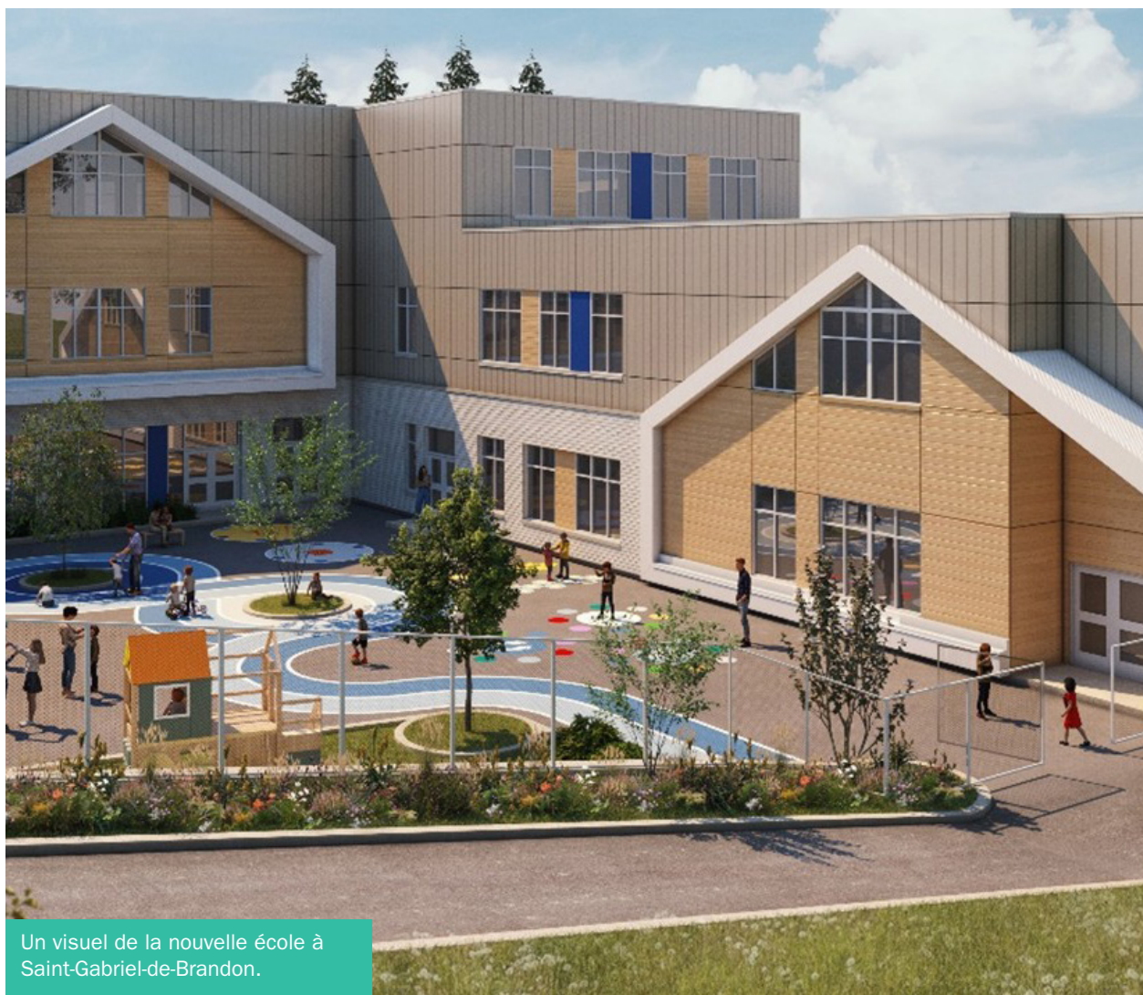
Un visuel de la nouvelle école à Saint-Gabriel-de-Brandon.

Les travaux pour une nouvelle école primaire à Saint-Gabriel-de-Brandon viennent de débuter. L'école comprendra 22 classes et elle accueillera 528 élèves. L'établissement sera bâti sur le terrain où se trouvent actuellement trois écoles primaires. L'ouverture est prévue après la semaine de relâche de 2027. Les trois autres bâtiments seront démolis et un stationnement pour les parents et le personnel sera aménagé.