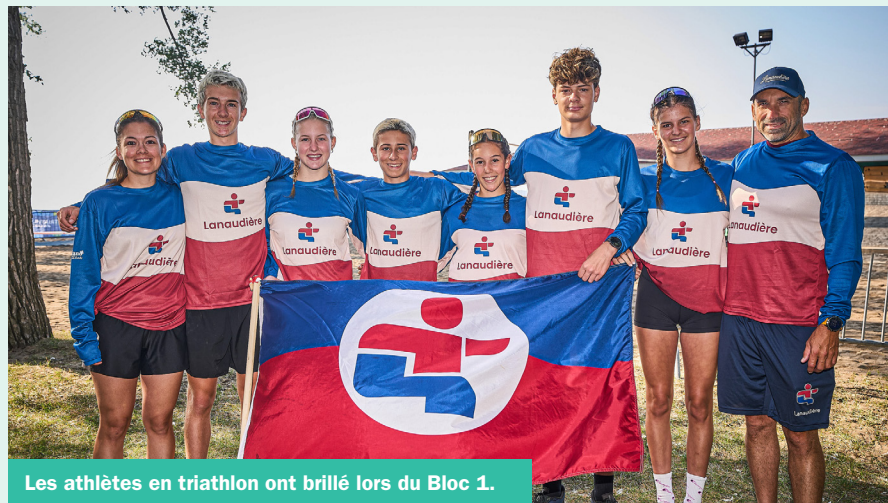
Les athlètes en triathlon ont brillé lors du Bloc 1.