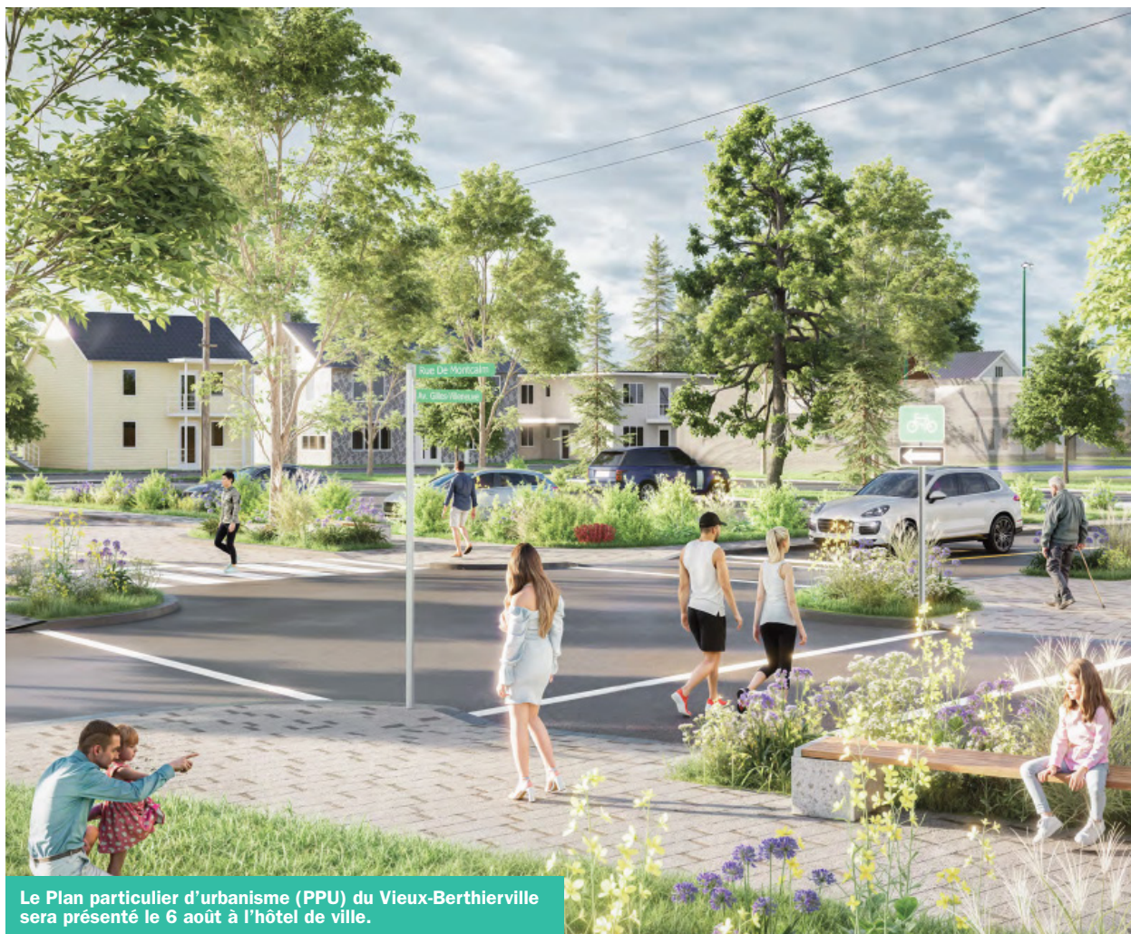
Le Plan particulier d'urbanisme (PPU) du Vieux-Berthierville sera présenté le 6 août à l'hôtel de ville.