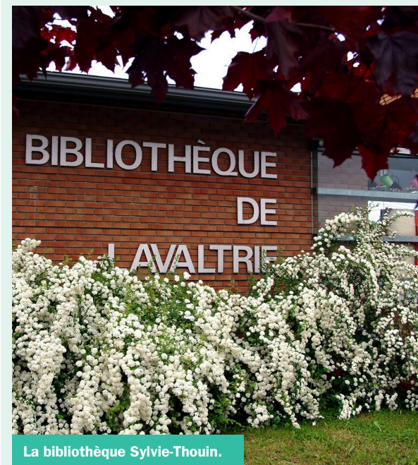
La bibliothèque Sylvie-Thouin.

Les places pour assister au gala du 18 septembre sont d'ores et déjà en vente au tarif de 25$ sur le site web du Théâtre du Vieux-Terrebonne.