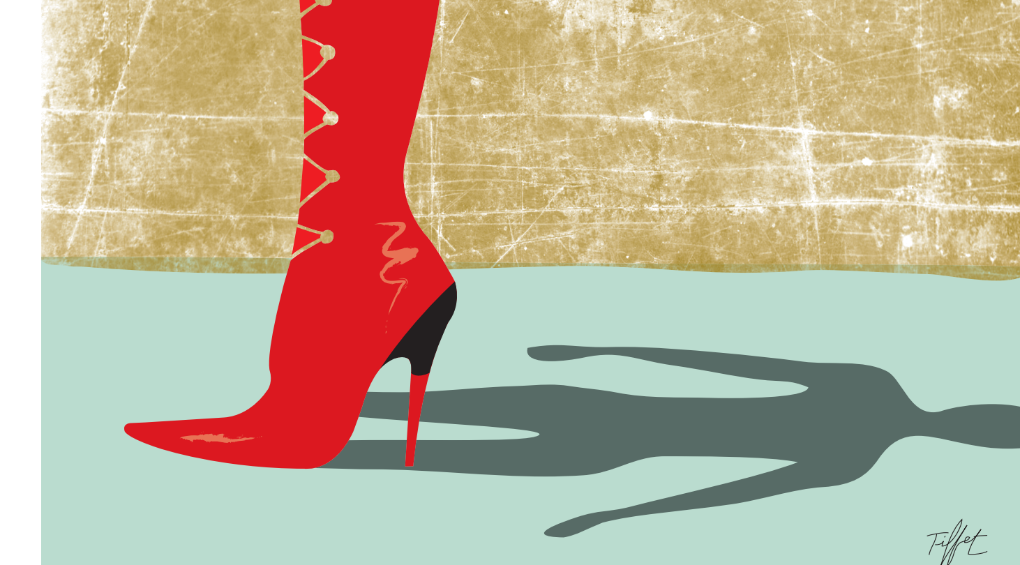
ILLUSTRATION CHRISTIAN TIFPET

Tout au long de l'article, M. Synnott, qui reprend l'essentiel du discours masculiniste de plus en plus présent au Québec, laisse sous-entendre que les femmes, et surtout les féministes, sont responsables