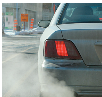
JACQUES GRENIER LE DEVOIR Nombre d'études ont déjà fait le lien entre smog, pollution atmosphérique et hospitalisation.

Nombre d'études ont déjà fait le lien entre pollution atmosphérique, smog et hospitalisation. Ce qui étonne ici, c'est que le facteur économique semble jouer un rôle important, voire déterminant. Les chercheurs ont en effet calculé que, pour les habitants des quartiers défavorisés vivant dans un rayon de 0,5 kilomètre d'une installation polluante, le taux d'hospitalisation pour des troubles circulatoires était de 1030 par 100 000, soit 16 % de plus que chez ceux des mêmes quartiers vivant à