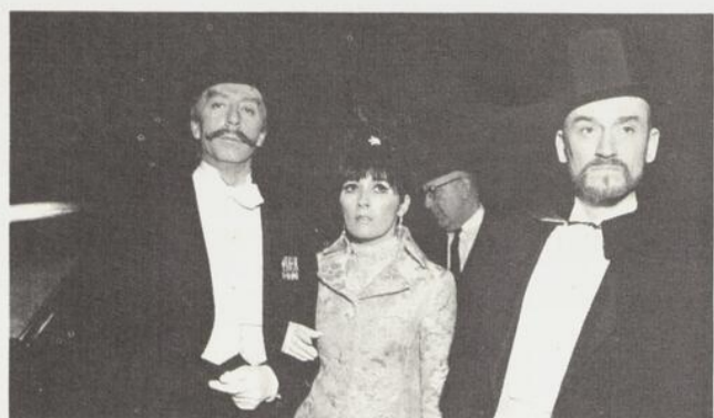
Paul Hébert, Monique Miller et Jean-Louis Roux.