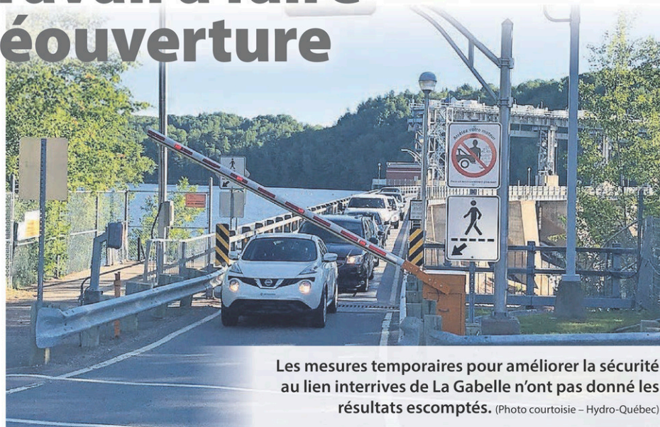
Les mesures temporaires pour améliorer la sécurité au lien interrives de La Gabelle n'ont pas donné les résultats escomptés.

Les données recueillies sur le terrain permettent de confirmer que 1000 véhicules circulent sur le lien interrives de La Gabelle chaque jour. «L'objectif, c'est d'assurer la sécurité à long terme de tous les