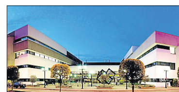
Université du Québec à Trois-Rivières