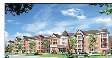
Le Havre du Faubourg Nicolet