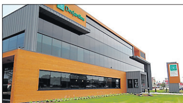
Caisse Desjardins Boulevard Jean-XXIII Trois-Rivières