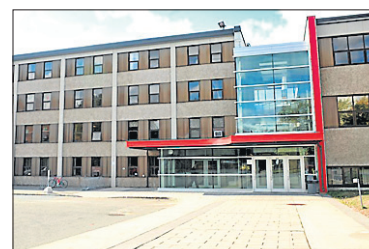
Cégep de Trois-Rivières