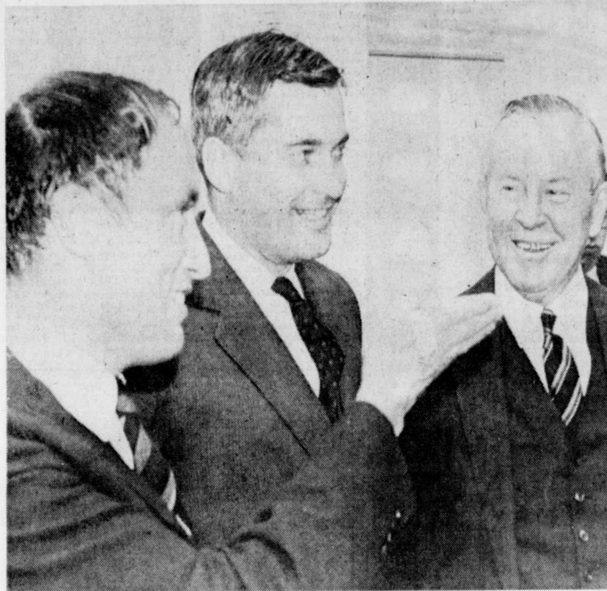
Le premier ministre Lester B. Pearson en compagnie de deux nouveaux ministres, Pierre Elliott Trudeau et John Turner, en 1967.

A première vue, cette information semble absolument farfelue, mais comme en politique tout est possible, j'ai cru mieux de la transmettre.