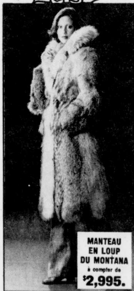
MANTEAU EN LOUP DU MONTANA à compter de $2,995.