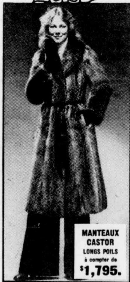
MANTEAUX CASTOR LONGS POILS à compter de $1,795.