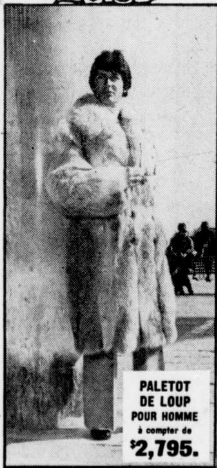
PALETOT DE LOUP POUR HOMME à compter de $2,795.