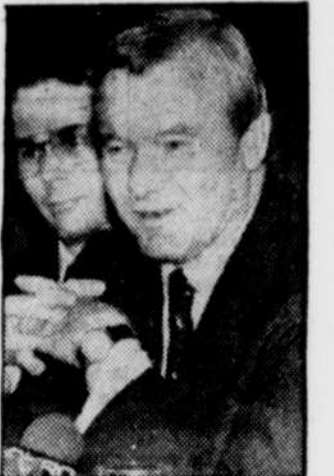
Le premier ministre d'Ontario, M. William Davis, persuadé que de fortes et rapides hausses du prix du pétrole canadien vont compromettre l'industrie manufacturière, a répété que les Ontariens sont prêts à payer le prix de l'autosuffisance énergétique au Canada.

déral devra investir $110 milliards en 10 ans s'il veut éliminer sa dépendance sur les autres pays pour ses besoins énergétiques. "Je crois qu'il s'agit là d'un défi que nous devons relever", a-t-il conclu.