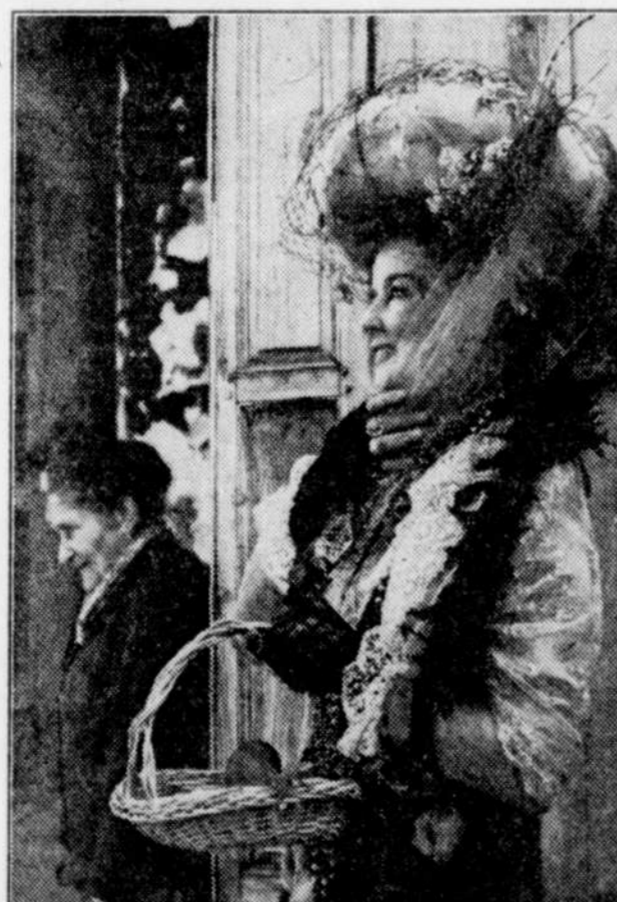
Katharine Hepburn joue le rôle de la comtesse Auréilia dans "La folle de Chaillot"