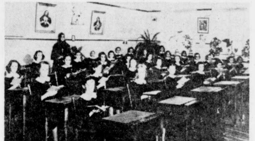
Après 15 ans, qu'est devenue l'Education au Québec?

Comme film, je vous propose "Les grands moyens", à Radio-Canada (canal 11), dans le cadre de l'émission LES GRANDS FILMS. Une comédie policière française où trois vieilles dames entreprennent de venger le meurtre de membres de leur famille.