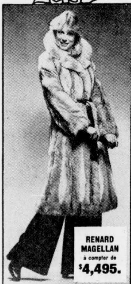
RENARD MAGELLAN à compter de $4,495.

DES ÉPARGNES TRÈS À POINT DURANT NOTRE GRANDE VENTE DE FOURRURES AVANT NOEL! VOUS Y TROUVEREZ SUREMENT LA FOURRURE DONT VOUS RÊVEZ...LE VISON DANS TOUTE SA SPLENDEUR, LE CASTOR, LE RAT MUSQUÉ, LE TRÈS RECHERCHÉ CHAT SAUVAGE ET AUTRES FOURRURES D'ALLURE SPORTIVE...A DES ÉPARGNES JUSTE À TEMPS POUR NOEL...C'EST L'OCCASION DE RÉALISER LE RÊVE DE VOTRE VIE!