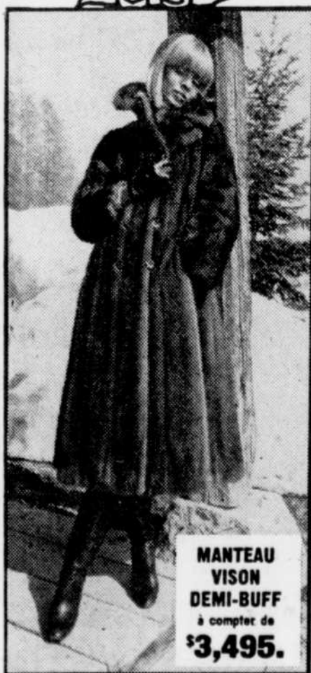
MANTEAU VISON DEMI-BUFF à compter de $3,495.