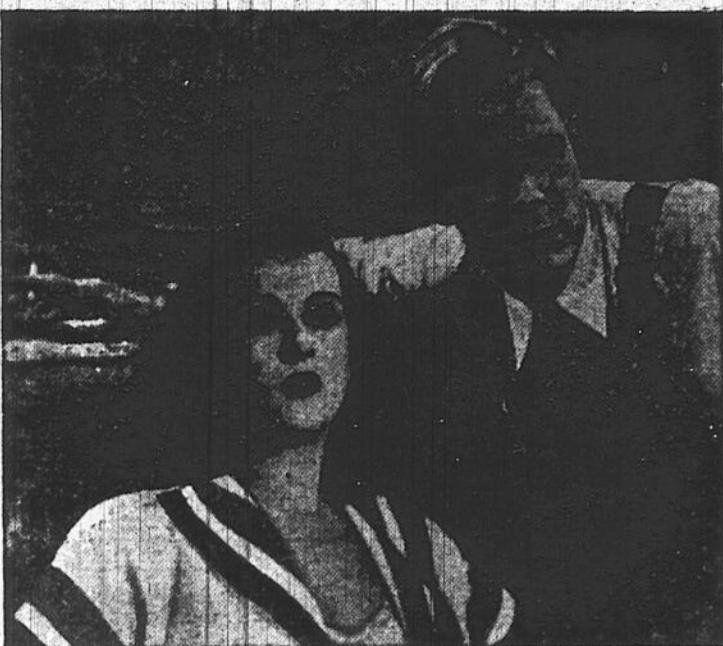
Dan Duryea et Joan Bennett dans une des scènes du puissant drame "Scarlet Street" qui prendra l'affiche vendredi au Palace.