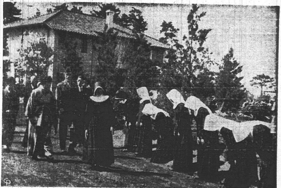
Les soeurs du couvent de Seishin (St-Paul), à Fujisawa, saluent l'impératrice Nagako, femme de l'empereur du Japon. L'impératrice a visité le couvent et entendu quelques adresses lues par des religieuses.