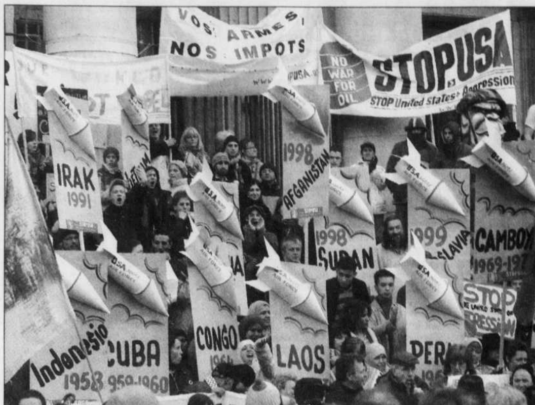
Les manifestations contre la venue à Bruxelles du président américain George W. Bush se sont succédées toute la journée hier, dans les rues de la capitale belge.

Sans exclure l'option militaire face à Téhéran, il a assuré conserver la diplomatie comme «premier choix» et