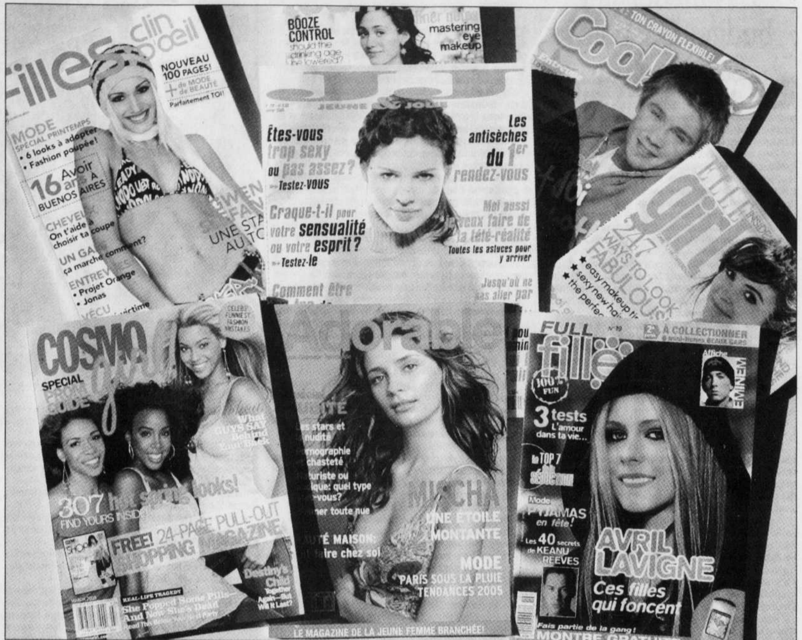
Les titres ciblant les adolescentes se sont multipliés depuis dix ans. Les tirages sont impressionnants: environ 85 000 chacun pour Cool et Filles Clin d'Œil [anciennement Filles d'aujourd'hui].

D'après ses travaux, près des deux tiers des articles portent sur l'apparence et les relations homme-femme, et un peu plus de la moitié des publicités concernent l'apparence (maquillage, shampooing, vêtement, esthétique...). «D'un côté, le contenu rédactionnel insiste sur l'importance de la beauté, de la sé-