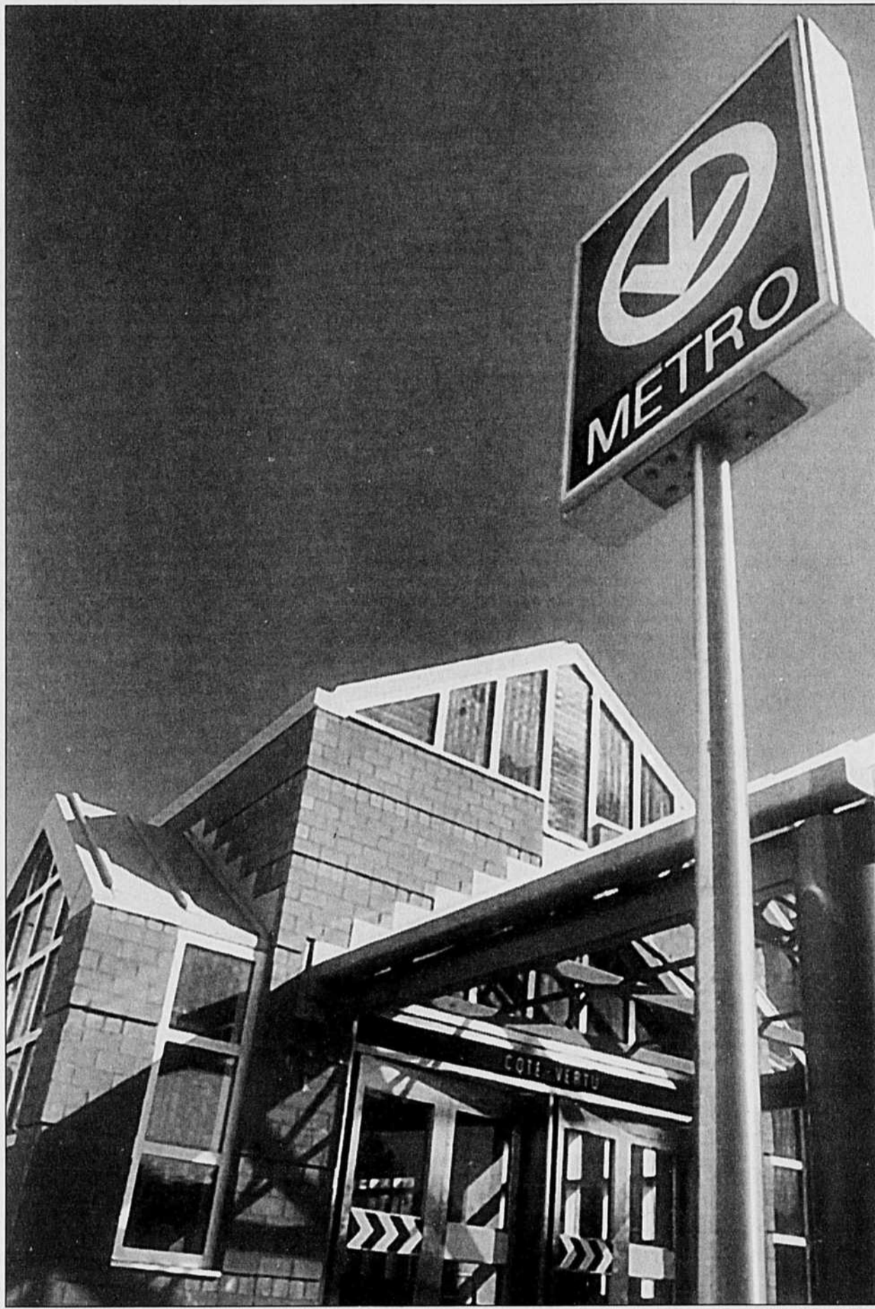
La station de métro Côte-Vertu: la prolongation de la ligne de métro n° 2 Ouest par Cartierville permettrait entre autres les correspondances avec le train de Deux-Montagnes.

Pour séduire la population disséminée sur son territoire, les autorités lavalloises et l'Agence métropolitaine de transport devraient aussi considérer l'usage du tramway, un mode qui dépasse l'autobus urbain en matière de crédibilité auprès des usagers, même en Amérique du Nord. Une ville allemande, Karlsruhe, de taille comparable à Laval, possède un réseau de tramway qui mérite qu'on s'y arrête. Grâce à des innovations technologiques et en matière de sécurité, les tramways roulent à la fois sur leur réseau propre et sur les rails des chemins de fer nationaux. Les Lavallois pourraient se rendre jusqu'au centre-ville en tramway moderne ou développer ce mode sur leur territoire et faire correspondre les passagers à une station de métro lavalloise. Bombardier est en mesure de construire ce genre de matériel. Soyons les Japonais des années 2000... imitons les Allemands.