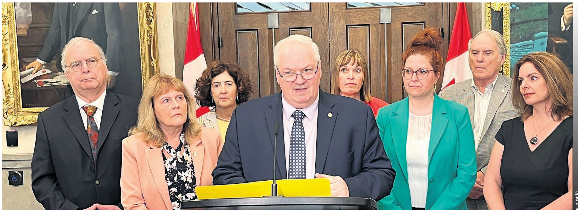
Luc Thériault a déposé un nouveau projet de loi demandant à Ottawa de modifier le Code criminel afin de permettre les demandes anticipées d'aide médicale à mourir à la suite d'un diagnostic d'un problème de santé, de maladie ou de trouble grave et incurable menant à l'incapacité.

«Nous devons permettre aux personnes qui désirent formuler une demande anticipée d'aide médicale à mourir de le faire, tout en assurant aux médecins qu'ils pourront agir sans crainte de poursuites. Nous avons une responsabilité envers les personnes souffrantes, et il est de notre devoir de ne pas les laisser tomber», a-t-il conclu.