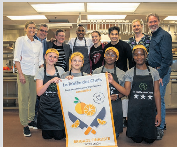
L'équipe de l'école secondaire des Trois-Saisons.

Fondées en 2012, celles-ci font partie d'un programme parascolaire offert dans les écoles secondaires au Québec et au Canada depuis 2019. Leur but est d'initier les jeunes de 12 à 17 ans à la cuisine et de développer leur esprit d'équipe et leur leadership à travers 24 ateliers culinaires animés par des chefs qualifiés. Plus de 250 écoles québécoises et plus de 40 écoles canadiennes participent activement à ce programme, témoignant de son impact positif et de sa portée grandissante.