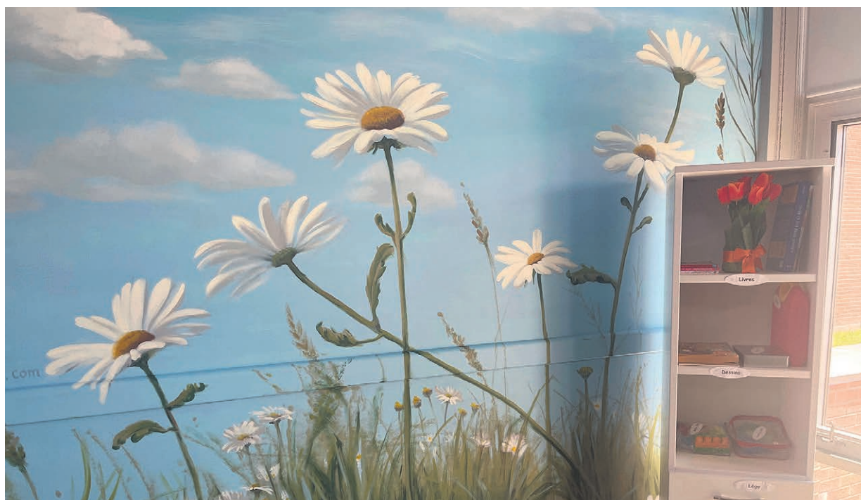
Les murs de la verrière sont recouverts d'une peinture de Maxime Lacourse.