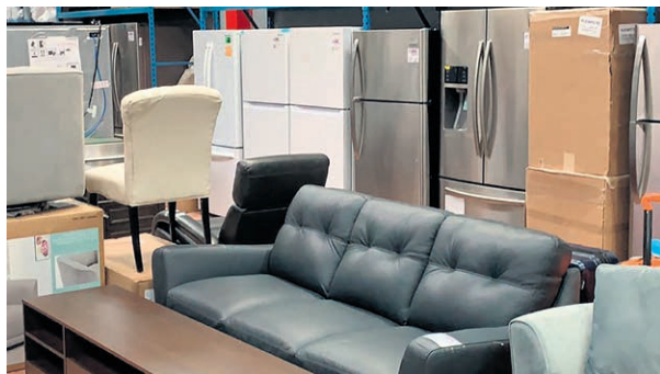
Xpert Liquidateur possède une deuxième succursale située au 358 rue Notre-Dame à Repentigny.

Pour rester informer des nouveaux arrivages, abonnez-vous à la page Facebook de Xpert Liquidateur ou rendez-vous directement en succursale.