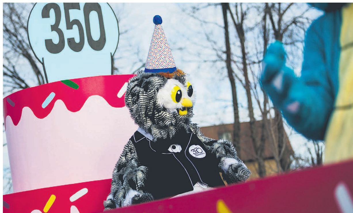
Pour la Ville de Terrebonne, la collaboration interdirections ayant eu cours tout au long des festivités du 350 e anniversaire est sans nul doute le legs qui apporte le plus de fierté à l'organisation.

Cette vérification visait à s'assurer que la Ville a mis en place un processus pour gérer la relève des postes stratégiques et à haute vulnérabilité dans l'éventualité où l'un de ces postes devrait être pourvu.