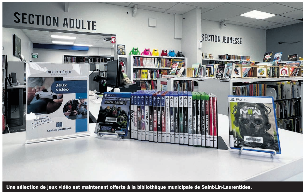
Une sélection de jeux vidéo est maintenant offerte à la bibliothèque municipale de Saint-Lin-Laurentides.

« Sans même avoir encore partagé la nouvelle via notre cahier des loisirs, je peux déjà voir un engouement chez les gens. Plusieurs semblaient agréablement surpris à leur entrée », s'est réjouie la bibliothécaire.