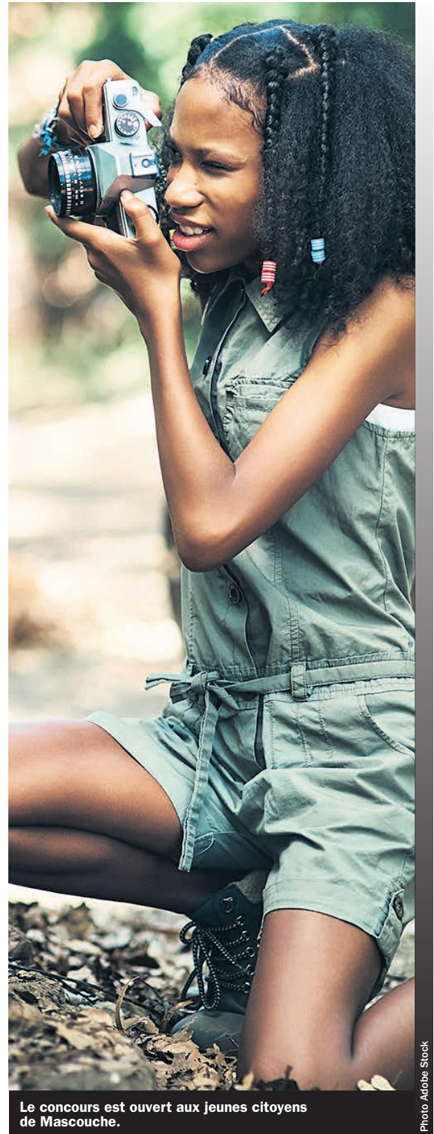
Le concours est ouvert aux jeunes citoyens de Mascouche.