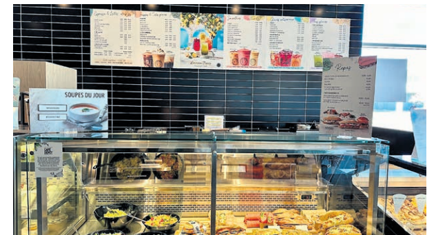
Le Café Dépôt est situé au 462 montée Masson à Mascouche.

N'hésitez pas à vous rendre en succursale et découvrir les produits par vous-même.