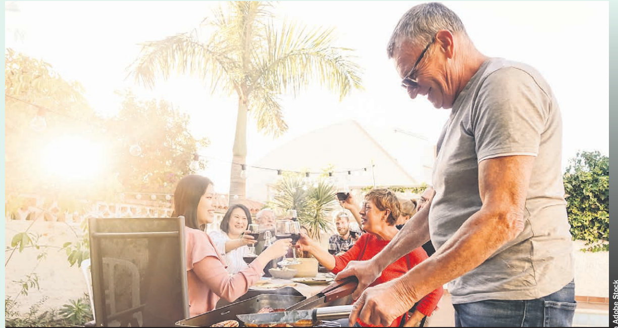
Plusieurs activités sont prévues dans la région au cours des prochains jours.

Le Bazar des filles d'Isabelle aura lieu les 3 et 4 août 2024 au Centre d'art Guy St-Onge à Saint-Calixte. Comptez 20$ pour louer une table pour une journée ou 30$ pour les deux jours. Il est conseillé de réserver rapidement. Info 450 898-6678 ou par courriel: lesflotsbleu@outlook.com. À noter que la clinique de sang se tiendra le mardi 6 août avec comme la présidente d'honneur M me Lucie Duquette.