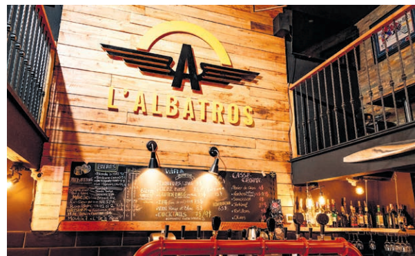
Tous les événements sont annoncés sur la page Facebook de l'Albatros.

Ce sont des rendez-vous à ne pas manquer cet été.