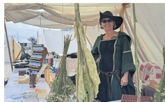
La Garde du Lys proposera un atelier interactif sur l'herboristerie.