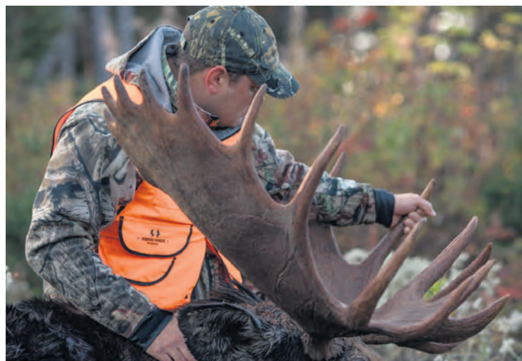
Le ministère des Forêts, de la Faune et des Parcs n'a pas l'intention de modifier les dates de chasse en raison des changements climatiques, pour le moment.

situation et pourra, au besoin, réévaluer les dates pour les périodes de chasse. « Il faudra alors réfléchir pour trouver un compromis entre les différents enjeux, dont la préservation de la viande, le succès de la chasse et la satisfaction de la clientèle », de conclure le relationniste.