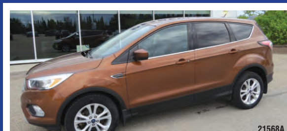
FORD ESCAPE SE AWD 2017 70 304 KM 20 495 $