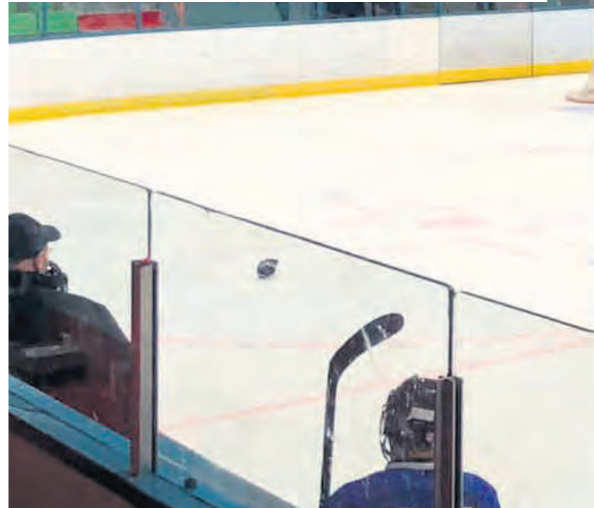
La violence au hockey mineur est une problématique qui existe depuis longtemps, mais des parents de la Haute-Côte-Nord souhaitent des sanctions plus sévères afin de décourager les jeunes à commettre des gestes illégaux.

Ce n'est pas la première fois que ce genre de situation se produit.