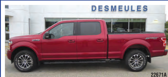
F150 XLT SUPERCREW SPORT 2019 59 909 KM 43 995 $