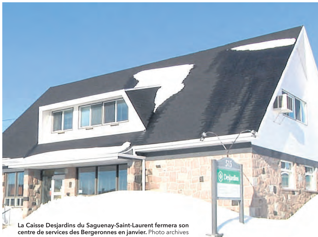
La Caisse Desjardins du Saguenay-Saint-Laurent fermera son centre de services des Bergeronnes en janvier.

Malgré les arguments apportés et les solutions proposées par le maire, entre autres la possibilité pour la Municipalité de prêter les locaux gratuitement à la Caisse, aucun terrain d'entente n'a été trouvé.