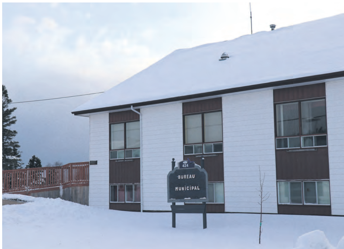
Le nombre de postes à combler ne dépasse pas l'entendement dans nos municipalités. Certaines ont tous leurs employés, tandis que d'autres cherchent 1 ou 2 ressources supplémentaires.

« On est arrivés à terminer la saison touristique de peine et de misère. Il nous man-