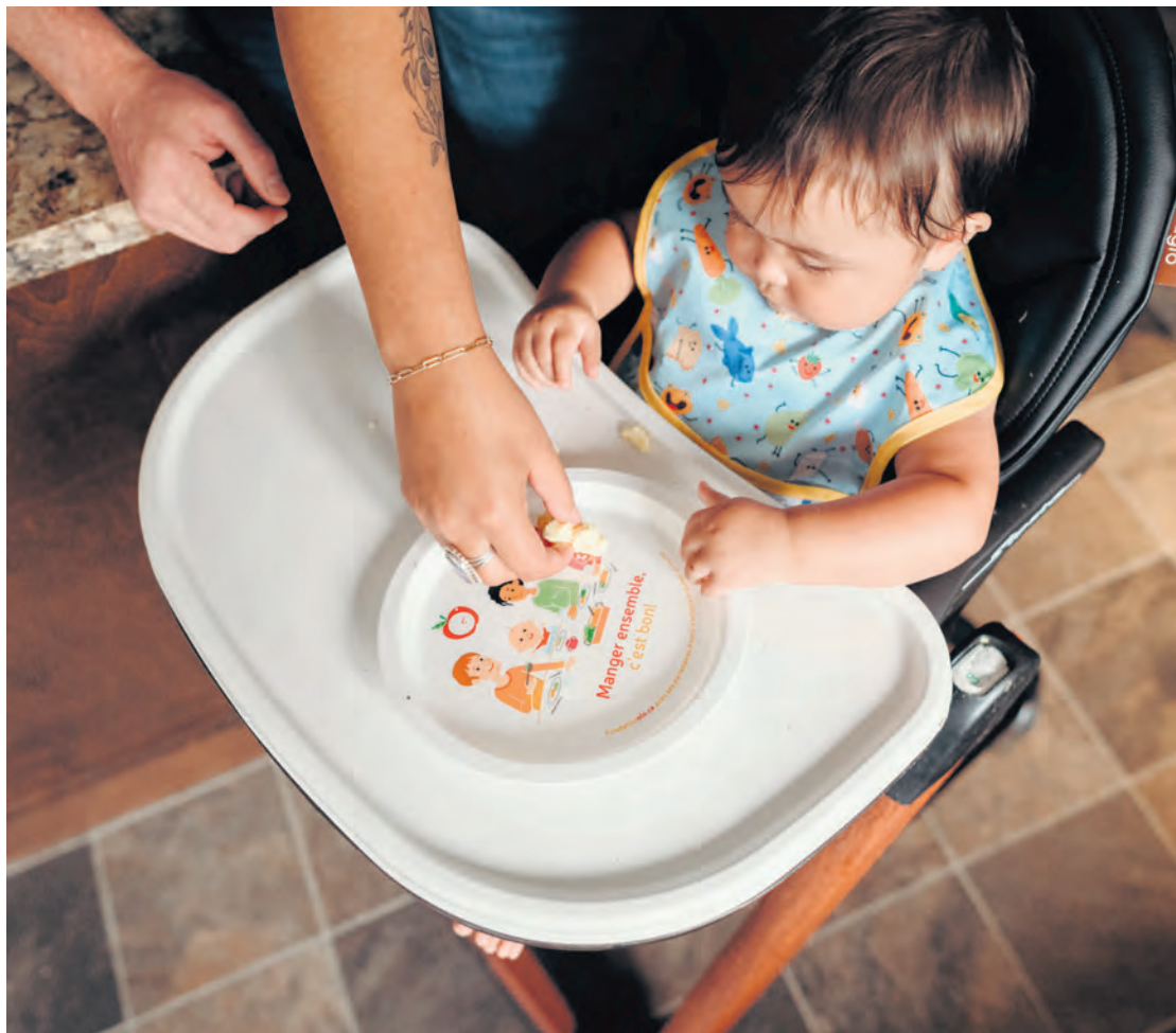
La Fondation Olo a révélé que 82 % des personnes sondées étaient préoccupées par leur capacité à se nourrir.

L'inflation actuelle fait en sorte que le coût du panier d'épicerie augmente alors