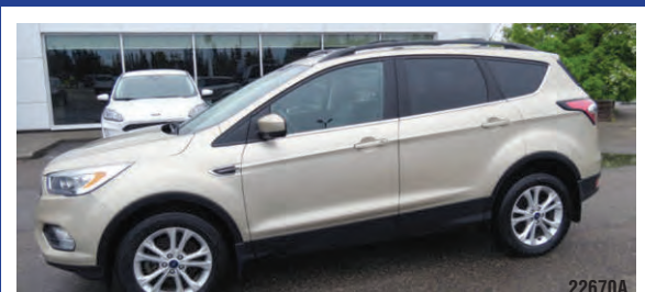
FORD ESCAPE SEL AWD 2018 55 232 KM 26 495 $