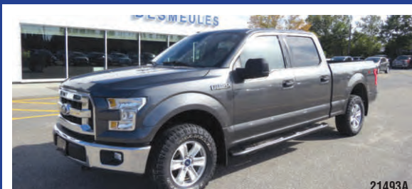
F150 SUPERCREW XLT 2016 64 803 KM 33 995 $

Venez nous consulter, nous pourrons vous aider!