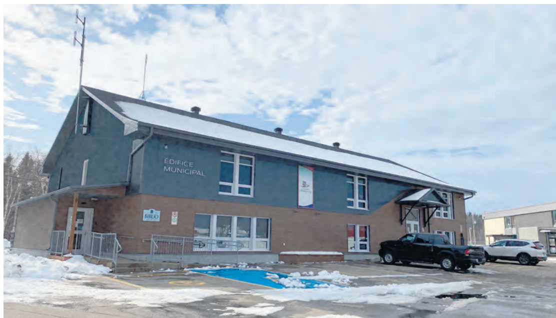
La Municipalité de Portneuf-sur-Mer a planifié ses travaux pour la dernière année de la Taxe sur l'essence et de la contribution du Québec 2019-2023.

Les élus souhaitaient entreprendre le remplacement du système d'eaux usées d'une partie de la rue Emond dans le cadre de la priorité 3, mais