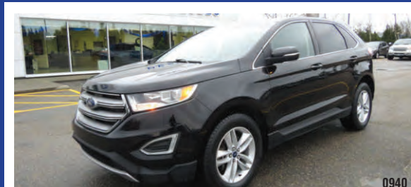
FORD EDGE SEL AWD 2018 65 181 KM 26 995 $