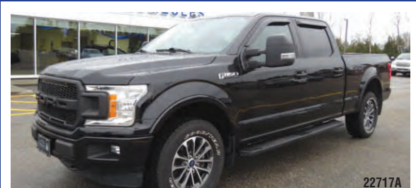
F150 XLT SUPERCREW SPORT 2020 59 737 KM 45 995 $