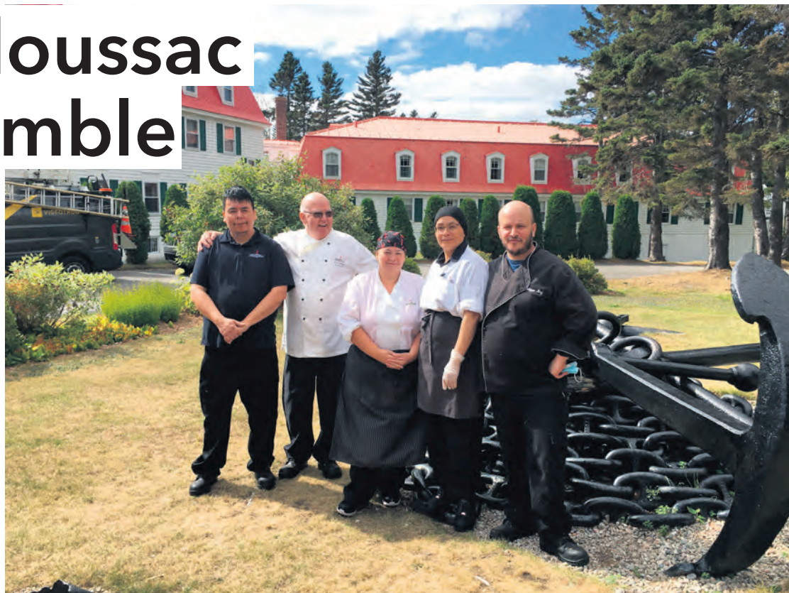
Des Innus de Pessamit ont visité l'Hôtel Tadoussac en avril dans le cadre du projet Mamu Atussetau (travaillons ensemble).

entreprise à Tadoussac sont organisées pour que les futurs employés puissent bien faire leur choix de l'endroit pour lequel ils veulent œuvrer.