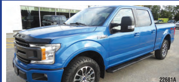
F150 XLT SUPERCREW SPORT 2020 28 433 KM 47 995 $