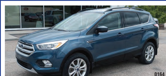
FORD ESCAPE SEL AWD 2018 47 261 KM 24 995 $