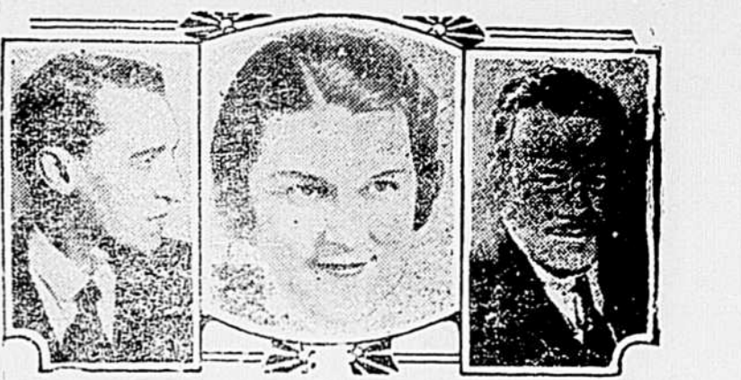
Lionel Daunais, Anna Malenfant, Ludovic Huot