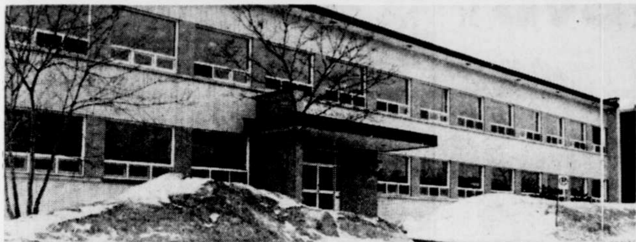
Ecole Saint-Louis de France

Québec, Le Soleil, vendredi 23 mars 1984