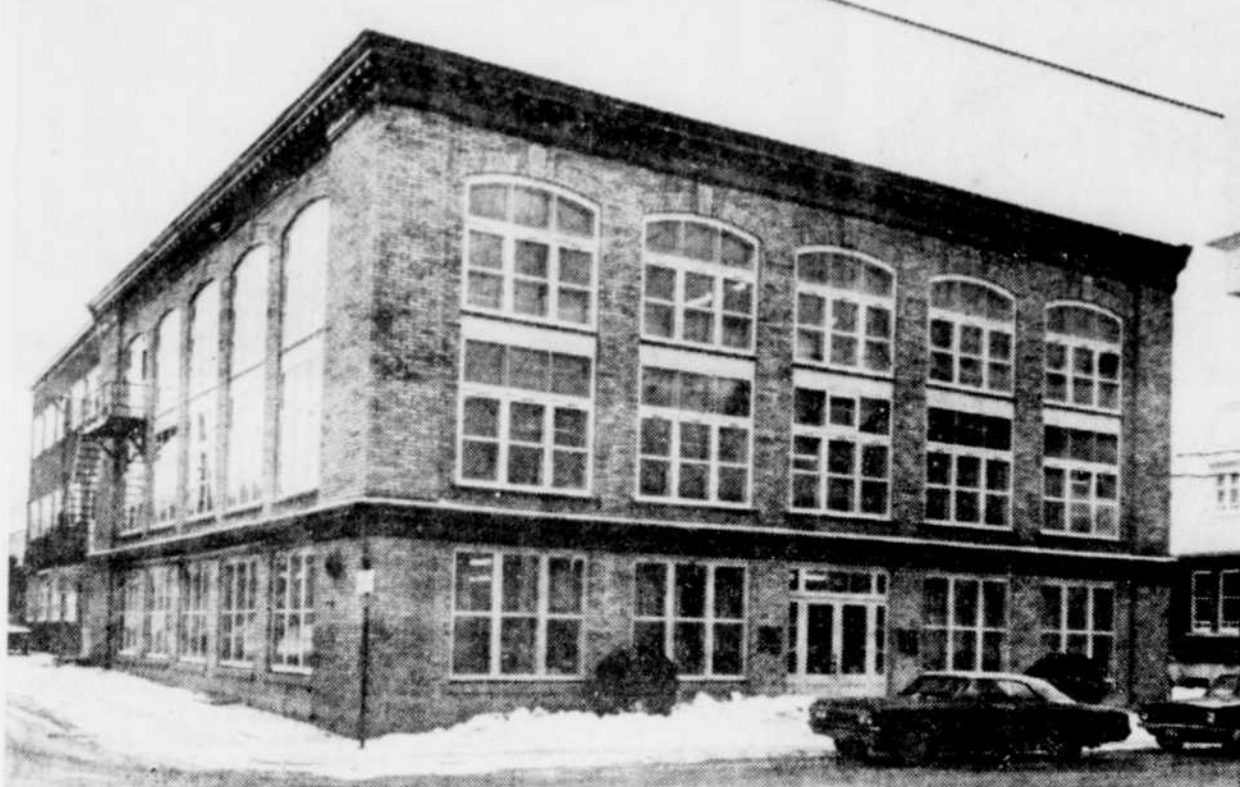
L'ancienne manufacture de chemises BVD, un immeuble inutilisé depuis quelques années, pourrait abriter 23 logements coopératifs.

Il y est prévu trois logements de cinq pièces et demi, 12 de quatre pièces et demi et huit de trois pièces et demi. Une salle communautaire sera aussi aménagée de même qu'u-