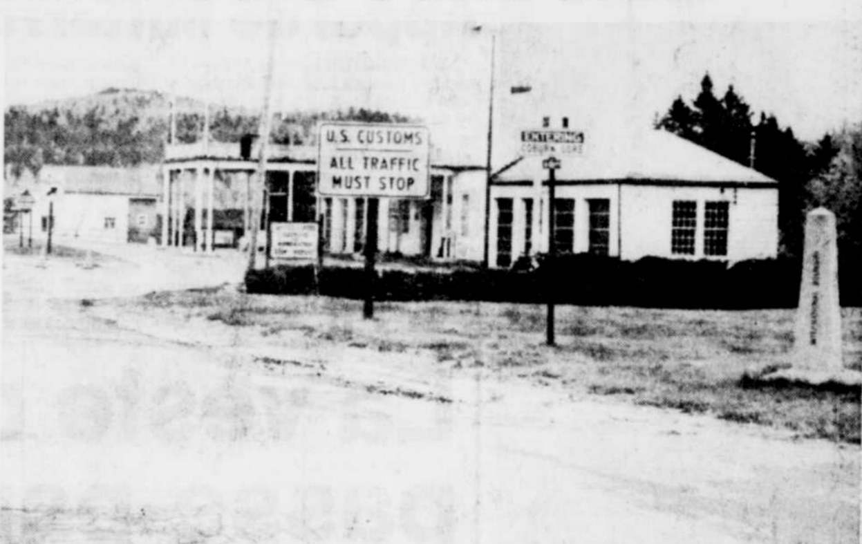
En passant au poste frontalier américain, au Maine, il faudra plus qu'un permis de conduire pour prouver sa citoyenneté canadienne.

de conduire des Etats américains, la photographie du détenteur apparaît alors que ce n'est pas le cas au Québec. On estime donc, à la frontière américaine, qu'il est ainsi plus facile de passer avec une fausse identification et que même si le conducteur québécois a, outre son permis de conduire, les enregistrements de la voiture, ce n'est pas toujours le cas des autres passagers qui n'ont souvent qu'une seule pièce d'identité.