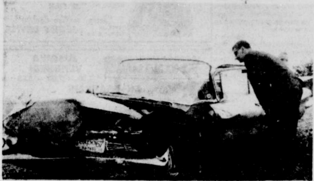
UNE COLLISION FRONTALE survenue près du Marché des animaux vivants, sur la route 5 à Princeville, a fait, dans la nuit de dimanche à lundi, un mort et trois blessés. Les blessés et le mort prenaient place dans la petite voiture Volkswagen que nous apercevons sur la première photo. La victime, qui a succombé