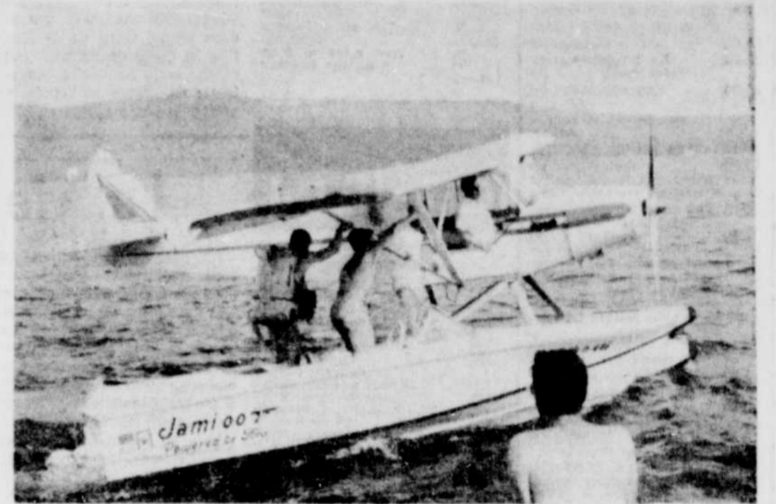
UNE FOULE NOMBREUSE a assisté dimanche après-midi aux régates du Lac Nicolet. Des conducteurs professionnels du Québec, des Etats-Unis et de l'Ontario se sont disputés les premières places des différentes épreuves au programme. En plus des courses proprement dites, les spectateurs ont pu assister à plusieurs activités. Ainsi, il y eut deux sauts en parachute, démonstrations d'avions téléguidés, démonstrations de gyrocoptère, spectacle de ski aquatique par des jeunes du Lac Nicolet, etc. Sur la première