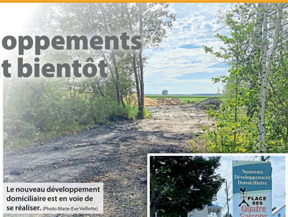
Le nouveau développement domiciliaire est en voie de se réaliser.

Pour accélérer la chose, le maire a l'intention de demander au ministère la permission de commencer le développement de la Place des Quatre Saisons parallèlement aux travaux d'assainissement. «Les plans sont prêts. Ce serait bien de pouvoir commencer [les deux projets] en même temps. Mais ce n'est pas certain du