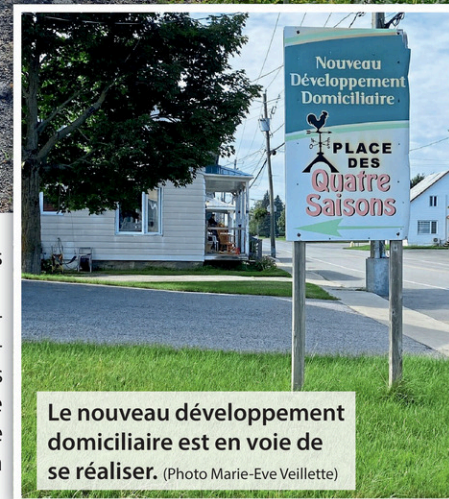
Le nouveau développement domiciliaire est en voie de se réaliser.

La Place des Quatre Saisons est un projet de développement immobilier par phases, comptant 45 terrains au total. Ces terrains sont principalement destinés à un usage familial et ont une dimension variant entre 7200 et 20000 pieds carrés. Le projet est prévu dans le prolongement de la rue Lacharité, parallèlement à la rue Arseneault.