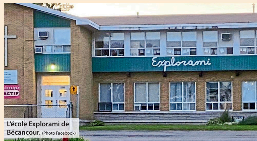
L'école Explorami de Bécancour.

Quatre autres écoles à Bécancour ont des projets d'agrandissement, soit l'école Beauséjour à Saint-Grégoire, l'école Bouton-d'Or à Précieux-Sang, l'école Harfang-des-neiges à Gentilly et la nouvelle école de Sainte-Angèle-de-Laval, mais aucun d'eux n'a encore reçu de réponse positive du ministère de l'Éducation.