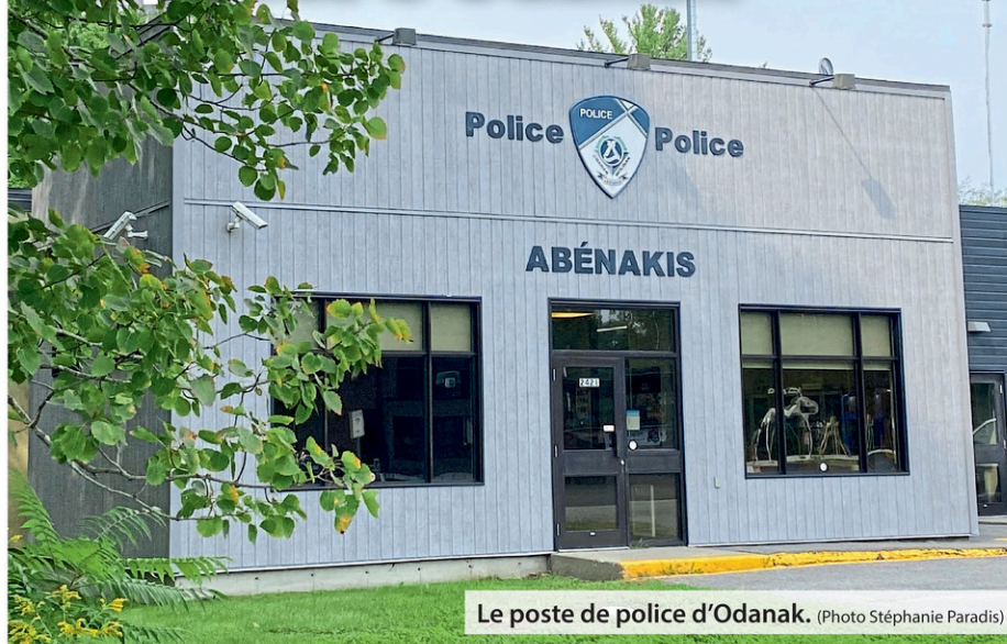
Le poste de police d'Odanak.