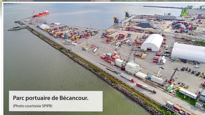
Parc portuaire de Bécancour.

«Les études seront lancées d'une semaine à l'autre. Évidemment, on ne pourra pas en faire beaucoup avant la fin de la saison, alors elles vont se poursuivre en 2025», conclut M. Olivier.