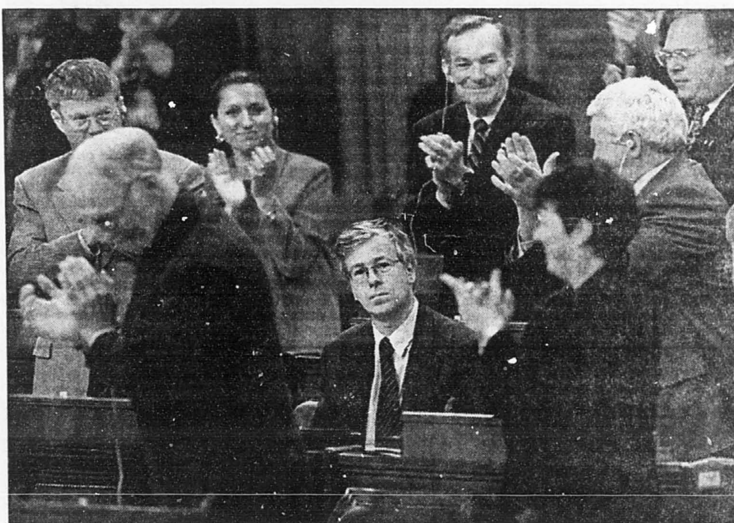
Le ministre des Affaires intergouvernementales canadiennes, Stéphane Dion (assis), a eu droit aux applaudissements des députés libéraux hier, aux Communes, après une intervention sur l'unité nationale.