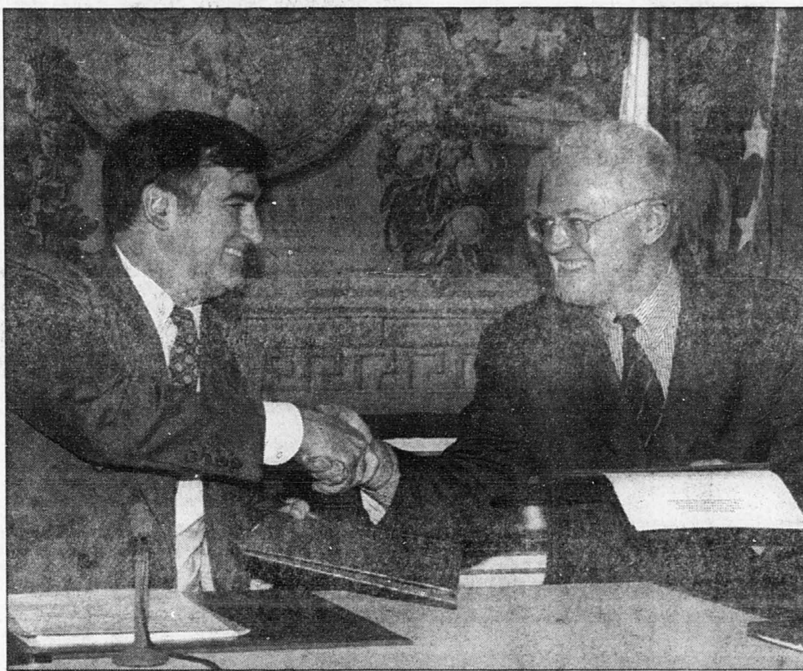
Le premier ministre du Québec, Lucien Bouchard, a rencontré hier, à Paris, son homologue français, Lionel Jospin.